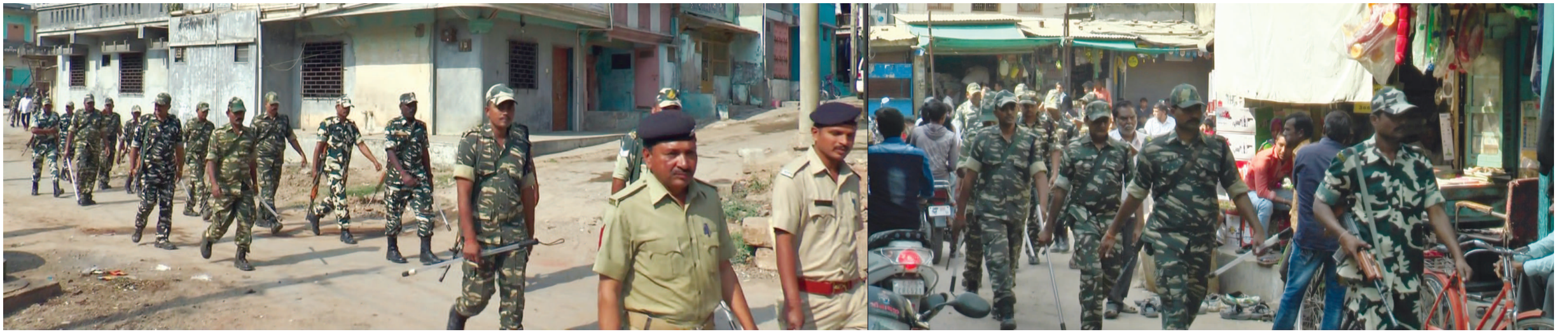
પ્રાંતિજ તથા તાલુકામાં વિધાનસભાની ચૂંટણીને પગલે ફ્લેગ માર્ચ યોજાઈ

સાબરકાંઠા જિલ્લાના પ્રાંતિજ તથા ગ્રામ્ય વિસ્તારોમાં વિધાનસભાની ચૂંટણીને અનુલક્ષીને પ્રાંતિજ તથા તાલુકામાં ફ્લેગ માર્ચ યોજાઈ હતી. સાબરકાંઠા જિલ્લા સહિત પ્રાંતિજ તાલુકામાં આવનારી વિધાનસભાની ચૂંટણીને ધ્યાને લઈને તંત્ર દ્વારા પ્રાંતિજ તથા તાલુકાઓ સંવેદનશીલ વિસ્તારોમાં સ્થાનિક પોલીસ તથા જવાનો દ્વારા ફ્લેગ માર્ચ યોજાઈ હતી અને પ્રાંતિજ પોલીસ સ્ટેશનથી નિકળી પ્રાંતિજના વિવિધ વિસ્તારોમાં ફ્લેગ માર્ચ કરવામાં આવ્યું હતું.