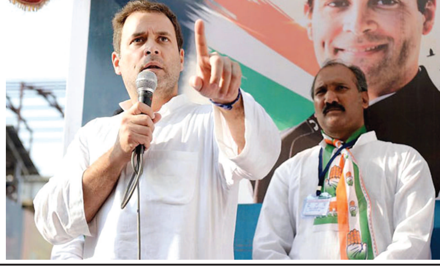
કરાવી દીધી. આમ મોદીએ લોકો પાસેથી રોજગારી પણ છીનવી લીધી છે. દેશમાં અમીર ઉદ્યોગપતિઓના દેવા-લોન માફ કરી દેવાય છે પરંતુ ગુજરાતના ખેડૂતોના દેવા માફ કરવામાં આવતા નથી. ખબર નથી

વીજળી, પાણી અને જમીન મોદીજી લઈ જાય છે અને તેમના મનની વાત સંભળાવી જાય છે. પરંતુ તેઓ કદી તમારા મનની વાત સંભળતા નથી. કોંગ્રેસની સરકાર આવશે તો, તમારા મનની વાત ગુજરાતની જનતાની વાત સંભળશે. રાહુલ ગાંધીએ વધુમાં જણાવ્યું હતું કે, મોદીએ હંમેશા બધું બધા પાસેથી લીધું જ છે. ગરીબો પાસેથી પણ ગળબરસિંહ ટેકસ વસુલે છે. કોંગ્રેસે દેશભરમાં મનરેગા યોજના લાગુ કરી રૂ. ૩૫ હજાર કરોડ ખર્ચ્યા હતા, તેટલી રકમ મોદીજીએ માત્ર એક જ કંપની ટાટા નેનો માટે ફાળવી દીધી...તમે વિચારો.. આ બધું વિચારવા જેવી વાત છે. અમારી મનરેગા યોજના જે લોકોને રોજગારી આપતી હતી તે પણ મોદીજીએ બંધ