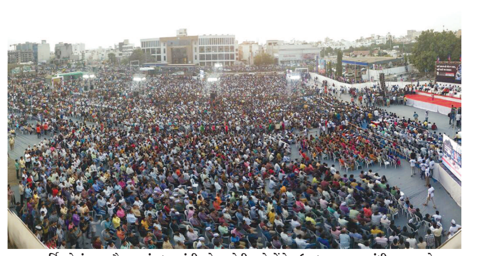
હાર્દિકનો હુંકાર - સૌરાષ્ટ્રમાં પ્રધાનમંત્રી નરેન્દ્ર મોદી અને કોંગ્રેસ ઉપાધ્યક્ષ રાહુલ ગાંધી સામ-સામે પ્રચાર સભાઓ ગજવી રહ્યા હતા ત્યારે રાજકોટમાં પાસના નેતા હાર્દિક પટેલે જંગી જનમેદની સમક્ષ વર્તમાન સરકારને પડકાર આપી ગ્રામીણ લઢણમાં સભા સંબોધી હતી... ચિકકાર માનવમહેરામણને સંબોધતા હાર્દિક પટેલે ટપી ડિસેમ્બરે આક્રમકતાથી સરકાર વિરોધમાં મતદાન કરવાની અપીલ કરી હતી...

મોરબીને ઊભું કરવામાં કોઈ પાછીપાની નથી કરી. બીજા રાજ્યોને જોઈ લો જ્યાં હોનારત થઈ હોય ત્યાં ૧૦ વર્ષ પછી પણ જે તે શહેર ઠીકથી ઊભું નથી થતું. અને મચ્છુ હોનારત પછી મોરબી ઊભું કરવામાં ભાજપને સફળતા મળી છે. તેમણે કહ્યું કે કોંગ્રેસનું વિકાસનું મોડેલ હેન્ડપંપ છે અને ભાજપના વિકાસનું મોડેલ છે ઘરે ઘરે પાછીના નળ, આજ છે ગુજરાતના વિકાસનું મોડેલ. હેન્ડપંપને આવવા માટે પણ કોંગ્રેસવાળા ૩-૩ ચૂંટણીના વોટ પડાવી જતા હતા. અમારી સરકારે ચેકડેમ્પની યોજનાથી ગામે ગામે