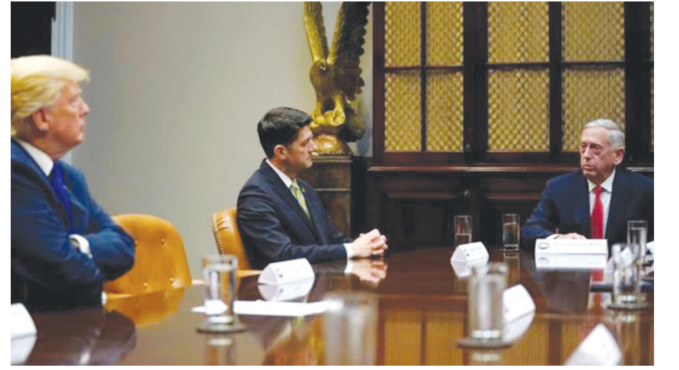
● અનુસંધાન પાન-૩ પર

શિયોલ, તા. ૨૯ અમેરિકા સહિતના દુનિયાના શક્તિશાળી દેશો તરફથી આપવામાં આવેલી ચેતવણીની ચિંતા કર્યા વગર ઉત્તર કોરિયાએ આજે ફરી એકવાર બેલાસ્ટિક મિસાઈલ ઝીંકતા વિશ્વના દેશો હચમચી ઉઠ્યા છે. ઉત્તર કોરિયાએ બેલાસ્ટિક મિસાઈલ પરીક્ષણ કરીને તમામને ચોંકાવી દીધા છે. હવે ઉત્તર કોરિયા સામે કાર્યવાહી કરવા માટે સતત દબાણ અમેરિકાના પ્રમુખ ડોનાલ્ડ ટ્રમ્પ પર વધી રહ્યું છે. અમેરિકાએ કઠોર પ્રતિક્રિયા આપીને દુનિયા માટે ખતરા તરીકે