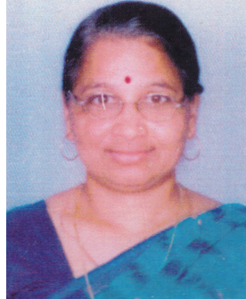
ઉષાબેને એમ ચૌહાણ કન્વીનર માતૃભૂમિ યુવા શક્તિ કેન્દ્ર