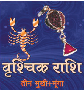
વૃશ્ચિક રાશિ ત્રીજા મુખી+મૂંગા

વિ.સં. ૨૦૭૫ના વર્ષની શરૂઆતમાં ગુરૂ તમારી રાશિમાં રહેતા તા. ૨૯-૩-૧૯૯૫થી તમારા બીજા ધનભાવે આવશે તા. ૨૨-૪-૧૯૯૫થી વક્રી ગુરૂ પાછો તમારી રાશિમાં આવશે. શનિ આપું વર્ષ તમારા બીજા ધનભાવે રહે છે. અહીં તમારે સાડાસાતી પનોતીનો ત્રીજો અને છેલ્લો તબક્કો રૂપાના પાયે ચાલશે. વર્ષની શરૂઆતમાં રાહુ તમારા નવમા ભાગ્યભાવે અને કેતુ ત્રીજા પરક્રમ સ્થાને રહેતા તા. ૭-૩-૨૦૧૮થી રાહુ તમારા આઠમા સ્થાને અને કેતુ તમારા બીજા ધનસ્થાને આવશે.