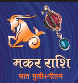
મકર રાશિ સાત મુખી-નૌલમ

વિ.સં. ૨૦૧૫ના વર્ષની શરૂઆતમાં ગુરુ તમારા લાભભાવે રહેતા તા. ૨૯-૩-૨૦૧૮થી તમારા બારમા વ્યવસ્થાને આવશે. તા. ૨૨-૪-૨૦૧૮થી વક્રી ગુરુ તમારા લાભભાવે આવશે. શનિ આપુ વર્ષ તમારા બારમા વ્યવસ્થાને રહે છે.