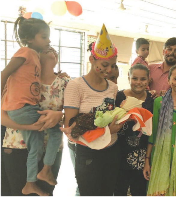
ગાંધીનગરની નર્સિંગ કોલેજના વિદ્યાર્થીઓ દ્વારા 'બાળ દિવસ'ની ઉજવણીના ભાગરૂપે સિવિલ હોસ્પિટલના બાળદર્દીઓના વોર્ડમાં જઈ વિવિધ વેશભૂષા સાથે બાળદર્દીઓને હસાવવાનું કાર્ય કર્યું હતું.