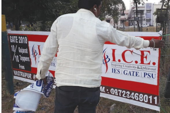
તંત્રએ આજે શહેરના ઘ અને ચ માર્ગ પરથી નાના મોટા ૮૭ હોડીંગ્સ દુર કર્યા છે. હોડીંગ્સ તંત્રએ હટાવતા દબાણકારોમાં ફફડાટ ફેલાઈ જવા પામ્યો છે. ગાંધીનગર શહેરમાં ફરીવાર દબાણ તંત્ર સક્રિય બનતા દબાણકારોમાં હાહાકાર મચી જવા પામ્યો છે. તહેવારના દિવસોમાં દબાણ શાખાએ શાંતિ જાળવતા દબાણ કારો સક્રિય થઈ ગયા હતા. દબાણ શાખાના કમચારીઓએ આજે શહેરના મુખ્ય માર્ગો પરના સર્કલો પર ઠેરઠેર નાના મોટા લગાવેલા હોડીંગ્સ દુર કર્યા હતા. શહેરના મુખ્ય માર્ગો પર ચીપકાવેલા ૮૭ હોડીંગ્સ દુર કરતા શહેર પણ ચોખ્ખુચણક દેખાતુ હતું. શહેરના

ગાંધીનગર, તા. ૧૪ ગાંધીનગર શહેરના મુખ્ય માર્ગો પર દબાણકારોએ અડીંગો જમાવી દીધો છે. શહેરના ઘ અને ચ માર્ગ પર ઠેરઠેર હોડીંગ્સ લગાવેલા નજરે પડતા હતા. ય અને ઘ માર્ગ પર આવેલા સર્કલો પર દબાણકારોએ પોતાના વેપાર અને હોટલ, ટયુશન ક્લાસ તેમજ સ્પર્ધાત્મક પરિક્ષાના ક્લાસના હોડીંગ્સ ચીપકાવી દીધા હતા. તંત્રએ સૌથી વધુ હોડીંગ્સના