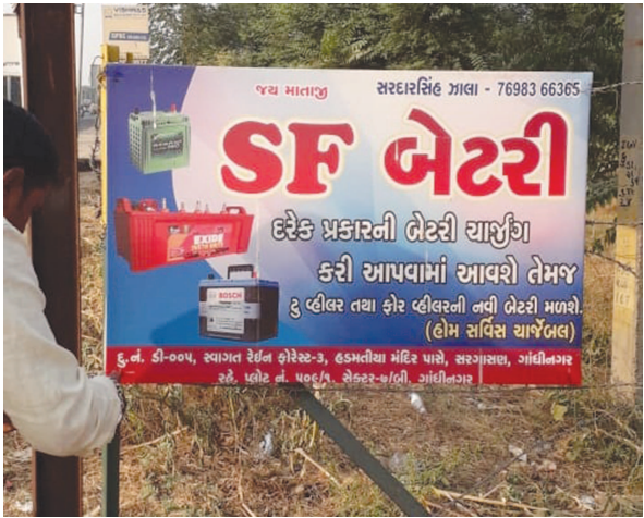
જ્યારે ય માર્ગ પરથી પણ છુટા છવાયા માર્ગો પર અને સેક્ટરોમાં રહેલા દબાણો દુર કરવામાં આવશે.

દબાણ ઘ-૦, ચ-૦, ઘ-૫, ઘ-૬ સહિતના સર્કલો પરથી દુર કર્યા