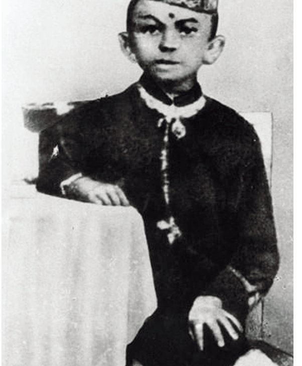
સોજન્ય : કુતલ નિમાવત સંપાદિત પુસ્તક 'ગાંધીકથા' કથાકાર : સ્વ. શ્રી નારાયણ દેસાઈ

અદભૂત પ્રસંગ! જમવાનો સમય છે. બધા સત્યાગ્રહીઓ લાઈનમાં ઊભા છે. એક મોટા તપેલામાં ખિચડી છે, જે પિરસવા માટે લાકડાનો હાથેક મટો ચમચો ગાંધીજીએ બનાવ્યો હતો. આમ તો દરેક સત્યાગ્રહીને ભોજન માટે એક પાઉં એટલે આખી એક લોક અને એક અંશ દાળ આપવી એમ જ નક્કી કર્યું હતું. પણ પછી ભારતીય વેપારીઓએ સત્યાગ્રહને સહાય શરૂ કરી ને એ કારણે ચોખા આવ્યા, દાળ આવી ને શાક પણ આવ્યું. એ કારણે પછી ખિચડી બનાવવાનું શરૂ કર્યું. (ક્રમશઃ)