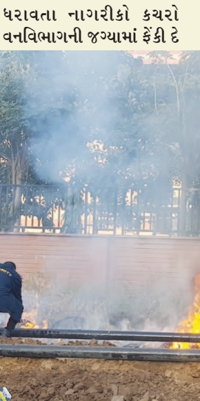
છ. આ વિસ્તારની બંને બાજુ પ્લાસ્ટીકનો તેમજ કાગળનો