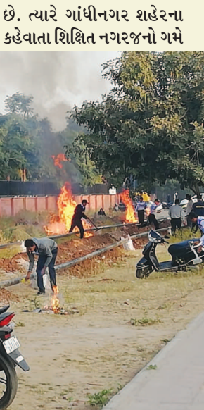
ત્યારે ગમે ત્યાં કચરો સળગાવતા નજરે પડે છે. શહેરના ઘ-૦ થી