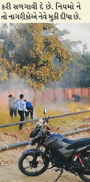
જાહેરમાં કચરો સળગાવતા નગરજનોને ભારે નુકશાન પહોંચે

ગાંધીનગર, તા. ૧૭ ગાંધીનગર શહેરને સ્વચ્છ અને સુંદર બનાવવા માટે તંત્ર દ્વારા કમરકસવામાં આવી રહી છે. સ્વચ્છતાને લઈ તંત્રના અધિકારીઓ રાત દિવસ એક કરી રહ્યા છે. તેમ છતાં શહેરના કેટલાક વિસ્તારમાં નગરજનો દ્વારા અરેપક કચરો ફેંકવાની પ્રવૃત્તિ કરવામાં આવી રહી છે. ત્યારે સફાઈ કર્મચારીઓ કે નાગરીકો દ્વારા એકઠો થયેલો કચરો જાહેરમાં સળગાવવામાં આવી રહ્યો છે. જાહેરમાં કચરો સળગાવનાર સામે તંત્રએ લાલ આંખ કરવાની તાતિ જરૂરીયાત ઉભી થવા પામી છે.