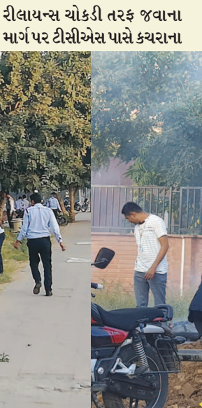
ઢગ ખડકાયેલા જોવા મળે છે. ગમે ત્યાં કચરો ફેંકવાની કુટેવ