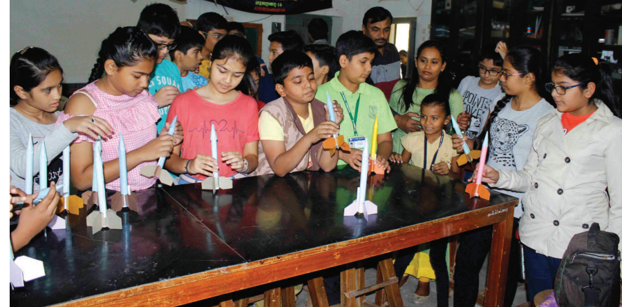
ગુજરાત વિદ્યાપીઠ, અમદાવાદ ખાતે વિજ્ઞાન પ્રદર્શનનું આયોજન કરવામાં આવ્યું હતું. જેમાં જુદી જુદી સ્કૂલના વિદ્યાર્થીઓ જોડાયા હતા.

જન્મદિને વધામણી વિભાગ અંતર્ગત કોઈપણ વાયક પોતાની તસવીરો પ્રકાશન માટે મોકલી શકે છે. પરંતુ વાયકોને વિનંતી છે કે મોડામાં મોડી આ તસવીરો જન્મદિવસ હોય તેના અગાઉના દિવસે એક વાગ્યા સુધીમાં અખબારને મળી જાય. વાયકો ઈચ્છે તો આ વિભાગમાં પ્રકાશન હેતુ પોતાની તસવીરો અગાઉથી પણ મોકલાવી શકે છે. - સંપાદક