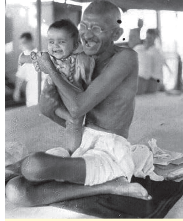
સોજન્ય : કુંતલ નિમાવત સંપાદિત પુસ્તક 'ગાંધીકથા' કથાકાર : સ્વ. શ્રી નારાયણ દેસાઈ

પરંતુ, શાંતિ નિકેતનથી આસામ સુધીની મુસાફરી દરમિયાન તેમણે કોંસ સંકેશન ઓફ સોસાયટી જોયું. મતલબ કે આ મુસાફરી દરમિયાન તેઓ અનેક પ્રકારના લોકોને મળ્યા. એમાં અમીર લોકો પણ હતા, ગરીબ લોકો પણ હતા. અનેક પ્રાંતોના અનેક પ્રકારના રાજકીય પક્ષોના કાર્યાલયોમાં પણ તેઓ ગયા, એ કાર્યાલયોના પદાધિકારીઓથી માંડીને પશ્ચિમ વડાઓ અને સામાન્યમાં સામાન્ય કાર્યકર સુધીના માણસોનેય મળ્યા. એમ કરીને તેમણે દેશને સમજાવવાનો પ્રયાસ કર્યો, દેશના લોકોને સમજાવવાનો પ્રયાસ કર્યો. (કમશઃ)