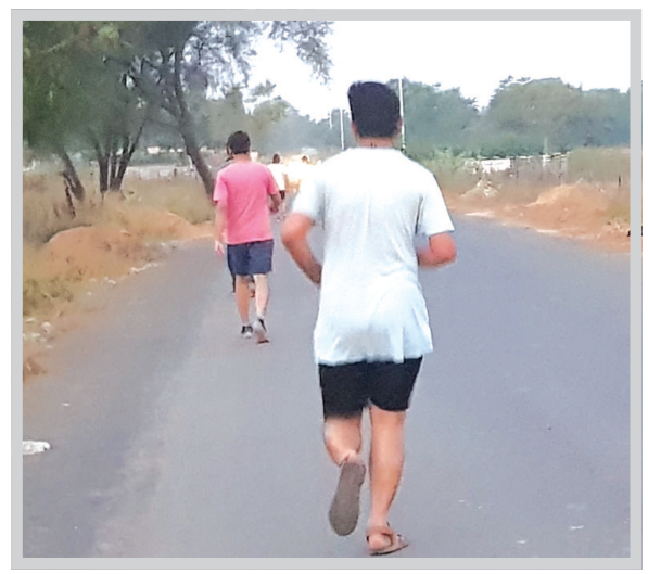
ગાંધીનગર, તા. ૧૮ ગાંધીનગરમાં ઠંડીનો ચમકારો વધુ તીવ્ર બન્યો છે અને ગઈકાલ કરતા તાપમાન વધુ ૦.૫ ડિગ્રી ગગડવા સાથે રાજ્યમાં સૌથી ઠંડુ શહેર તરીકે મોખરે રહેવા પામ્યું છે. ગઈકાલે શહેરમાં લઘુત્તમ તાપમાન જે ૧૪ ડિગ્રી હતું તે વધુ ઘટીને આજે ૧૩.૫ ડિગ્રી નોંધાયું છે.

પારો વધુ ગગડ્યો : લઘુત્તમ ૧૩.૫ ડિગ્રી સાથે ગાંધીનગર ફરી રાજ્યનું સૌથી ઠંડુ શહેર : મહત્તમ તાપમાન ૩૪ ડિગ્રી નોંધાયુ