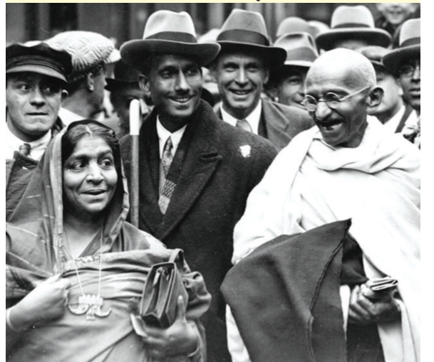
સોજન્ય : કુંતલ નિમાવત સંપાદિત પુસ્તક ‘ગાંધીકથા’ કથાકાર : સ્વ. શ્રી નારાયણ દેસાઈ

આશ્રમ સ્થાપતી વેળા ગાંધીજીએ આશ્રમ નિયમાવલી તૈયાર કરી અને તેને આખા દેશમાં ફરતી કરી. જણાવ્યું કે, જેને આ નિયમો જેમને સ્વીકાર હોય તે આશ્રમમાં રહેવા આવી શકે છે. એ વખતે એમના સમવચસ્ક એવા અમૃતલાલ ઠક્કર કે જે પછીથી ઠક્કરબાપા તરીકે ઓળખાયા, તેમણે ગાંધીજીને પત્ર લખીને જણાવ્યું કે, ‘હું એક દલિત પરિવારને મોકલું છું, જેણે તમારી આશ્રમ નિયમાવલી વાંચી છે અને એ નિયમો એમને સ્વીકાર છે. એ પરિવાર આશ્રમમાં રહેવા તૈયાર છે. તમે એને રાખશો?’ ગાંધીજી માટે તો સૌ સરખા હતા. તેમણે તરત હા પાડી ને આ દલિત પરિવાર આશ્રમમાં રહેવા આવી ગયો. પણ એ કારણે આશ્રમને મદદ કરતાં શ્રેણીઓના પાભા જરા ઉંચકાયા. એમને અંદાજ નહોતો કે ગાંધીજી એમના પ્રયોગો આટલા વહેલા શરૂ કરી દેશે! (કમશ:)