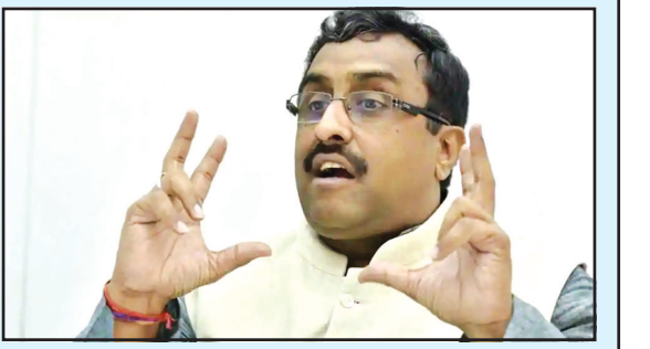
શ્રીનગર, તા. ૨૨

કાશ્મીરમાં સરકાર રચવાને લઈને પાકિસ્તાન તરફથી એનસી અને પીડીપીને સૂચના મળી હોવાના નિવેદન બાદ તીવ્ર પ્રતિક્રિયા પછી માધવે નિવેદન ખેંચ્યું