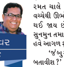
નવાં કલેવર નરવર હેડાઉ

દોય છે. તે વળાંકે ઊભો ઊભો ફક્ત બીજાને આવવા - જવાના સંકેતો દેતો રહે છે. અને તે પોતે ત્યાં ને ત્યાં જ ઊભો હોય છે. આમ જુઓ તો બધા રસ્તે મને ભુલભુલેલા જેવા લાગે છે. જેની દરેક ગલી બીજી બંધ ગલીમાં ખુલે છે, કેટલાક લોકો ભુમો પાડી પાડીને કહે છે અમારું તાવીજ ખરીદો તેમને વિવિધ સંતાપોમાંથી મુક્તિ આપવશે. પણ ખબરદાર કોઈને પોતાની જગ્યાએથી હલવાનું નથી. રમત ચાલે છે ત્યાં સુધી વચ્ચેથી ઊભો થનાર અંધ થઈ જાય છે. સૌ કોઈ સુનમુન તમાશો જુએ છે કે હવે આગળ શું થશે. 'જંબુરા ખેલ બતાવીશ?' 'બતાવીશ?' યાદરની નીચેથી અવાજ આવે છે. 'જંબુરા ખેલ શેના માટે છે?' 'ઉસાદ, પાપી પેટ માટે' યાદરની નીચેથી બોલે છે. તો સાહેબો, મહેરબાનો આ પાપી પેટ એવું છે કે ભરાવાનું નામ જ લેતું નથી. સવારે ભરીએ તો સાંજે ખાલી અને સાંજે ભરીએ તો સવારે એવું. મદારીનો ખેલ ચાલી રહ્યો છે. તે યાદર ઊંચી કરે છે. તમે જુઓ છો કે એક બાળકના ગળા નીચે છરી