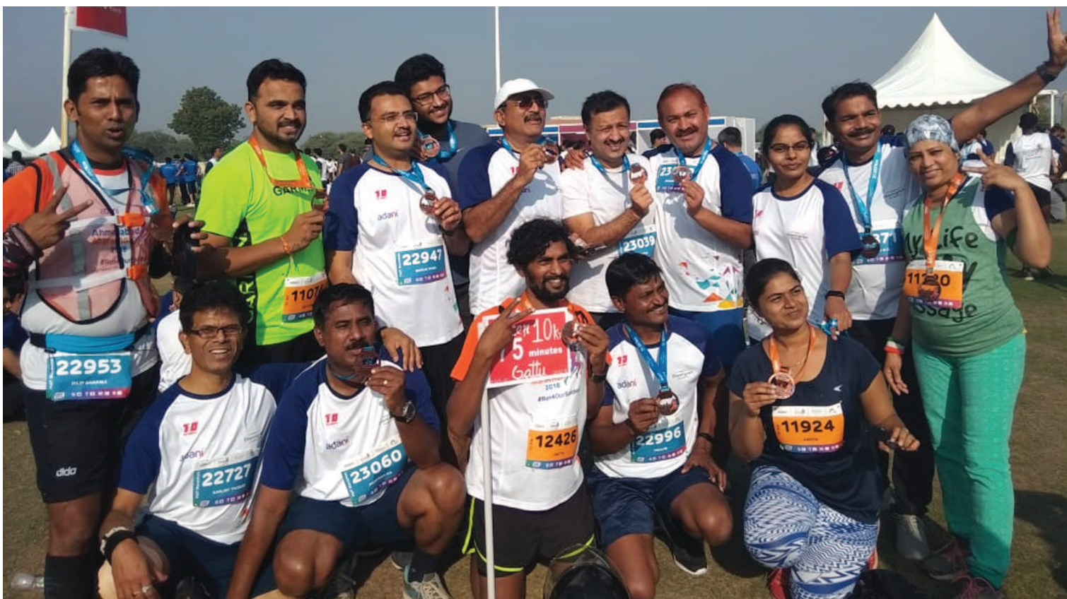
'રન ફોર અવર સોલ્જર' શિર્ષક હેઠળ અમદાવાદ ખાતે અદાણી મેરેથોનનું આયોજન કરવામાં આવ્યું હતું. આ હાફ મેરેથોન (૨૧.૦૯૭ કિમી)માં દેશનાં શહેરોનાં ૪ હજાર દોડારો સાથે ગાંધીનગર રનર્સ ગ્રુપના સભ્યોએ પણ ઉત્સાહથી ભાગ લીધો હતો અને દોડ સફળતાપૂર્વક પૂર્ણ કરી ફિનીશરનો મંડલ પ્રાપ્ત કર્યો હતો.