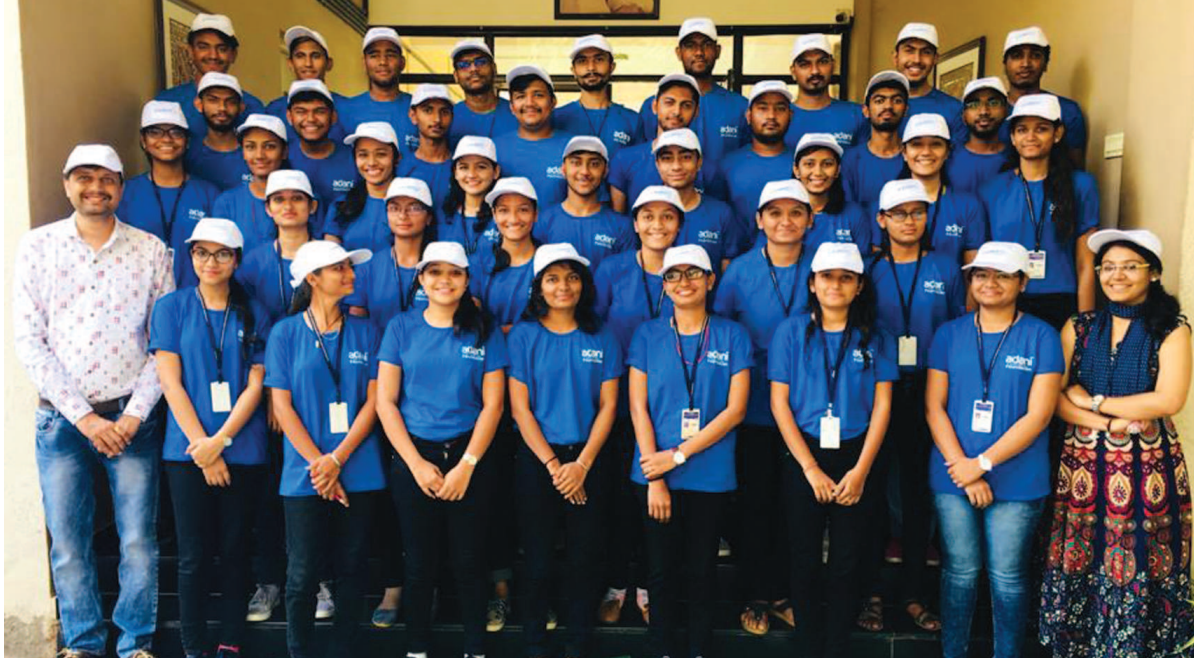
ગાંધીનગર, તા. ૨૭ કડી સર્વવિશ્વવિદ્યાલય સંલગ્ન બી.પી. કૉલેજ ઓફ બિઝનેસ એન્ડ મિનીસ્ટ્રીશન (બીબીએ)ના ૧૧૬ વિદ્યાર્થીઓએ મુન્દ્રા પોર્ટની બે દિવસીય મુલાકાત લીધી હતી. પ્રથમ દિવસે અદાણી પોર્ટ & SEZની મુલાકાત લીધી હતી. ત્યારબાદ વિદ્યાર્થીઓએ અદાણી વિલમાર કંપનીની મુલાકાત લઈ ઉત્પાદન અંગે વિશદ માહિતી પ્રાપ્ત કરી હતી.