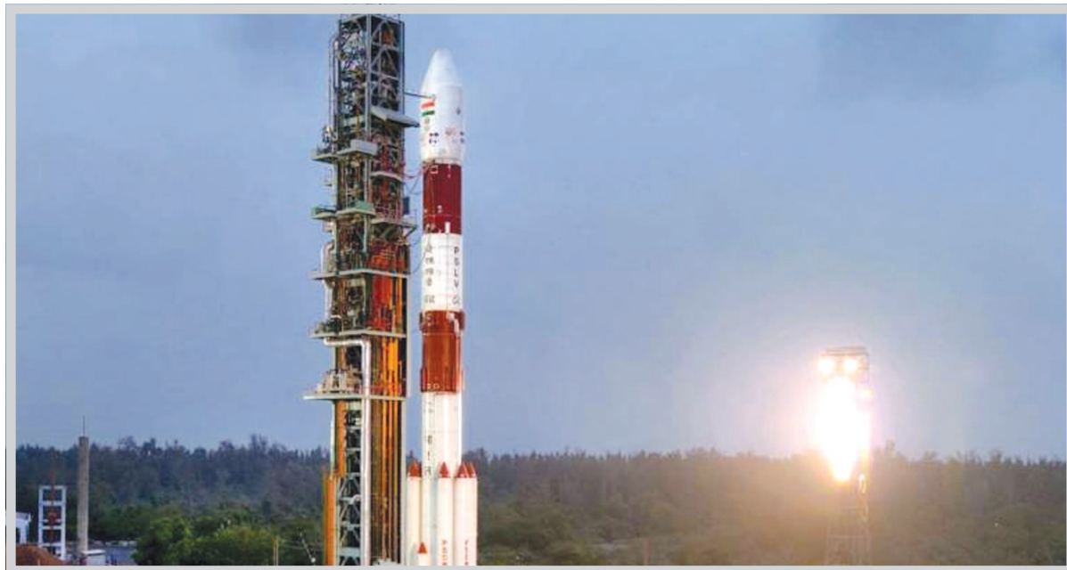
પહેલા શરૂ કરવામાં આવી હતી. ભારત ઉપરાંત અમેરિકા (૨૩ સેટેલાઈટ), ઓસ્ટ્રિયા, કેનેડા, કોલંબિયા, ફિનલેન્ડ, મલેશિયા, નેધરલેન્ડ અને સ્પેનના એક-એક ઉપગ્રહને લોન્ચ કરવામાં આવ્યા હતા. આમાં એક માર્શકો અને ૨૯ નેનો સેટેલાઈટ છે. ભારતના હાઈપર સ્પેક્ટ્રલ ઈમેજિંગ ઉપગ્રહ આ મિશનના પ્રાથમિક સેટેલાઈટ તરીકે છે. ઈમેજિંગ સેટેલાઈટ પૃથ્વીની નજર રાખવા માટે ઈસરો દ્વારા વિકસિત કરવામાં આવેલા વિશેષ ઉપગ્રહ તરીકે છે. ભારતના આ સેટેલાઈટમાં અનેક વિશેષતાઓ રહેલી છે. હાઈસ્પેક્સ ઈમેજિંગ અંતરિક્ષથી એક દ્રશ્યના દરેક પિક્સલના પિક્ચરને વાંચવા ઉપરાંત પૃથ્વી પરની વસ્તુઓ, સામગ્રી અને પ્રક્રિયાઓની ઓળખ

શ્રીહરિકોટા, તા. ૨૯ ભારતીય અંતરિક્ષ સંશોધન સંસ્થા (ઈસરો)એ આજે તેની યથક્લગીમાં વધુ એક મોરપીછું ઉમેરી લીધું હતું. ઈસરોએ પોલાર સેટેલાઈટ લોન્ચ વ્હીકલ સી-૪૩ મારફતે આજે સવારે એકસાથે ૩૧ સેટેલાઈટ સફળતાપૂર્વક લોન્ચ કર્યા હતા. આ પ્રસંગે ઈસરોના તમામ ટોચના અધિકારીઓ હાજર રહ્યા હતા. સફળ લોન્ચ બાદ ઉપસ્થિત અધિકારીઓમાં મુશીનુ મોજુ ફરી વળ્યું હતું. આંધ્રપ્રદેશના શ્રીહરિકોટામાં સ્થિત સતીશ ધવન અંતરિક્ષ કેન્દ્ર પરથી સવારે ૯.૫૮ વાગે તમામ સેટેલાઈટને લોન્ચ કરવામાં આવ્યા હતા. પીએસએલવીની આ ૪૫મી ઉડાણ હતી. આ ઉપગ્રહોને છોડવા માટે તેમના વાણિજ્ય વિભાગ સાથે