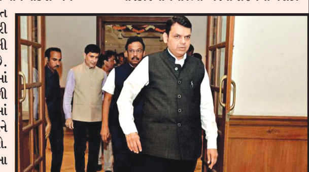
મરાઠા સમુદાયને અનામત આપવા સાથે સંબંધિત ચર્ચાસ્પદ બિલને આજે મહારાષ્ટ્ર વિધાનમંડળમાં પાસ કરી દેવામાં આવ્યો હતો. મહારાષ્ટ્ર વિધાનસભામાં મરાઠાઓને નોકરી અને શિક્ષણમાં ૧૬ ટકા અનામત આપવા સાથે સંબંધિત પાસ કરી દેવામાં આવ્યું છે. બંને ગૃહની સર્વસંમતિ હવે મળી ચુકી છે. વિધાનસભામાં આ પ્રસ્તાવ મુકવામાં આયા બાદ બંને ગૃહની મંજૂરી મળી ગઈ છે. સરકાર હવે ટૂંક સમયમાં જ કાનૂની ઓપરેશન પૂર્ણ કરીને આને અમલી કરવાના પ્રયાસ કરશે. મહારાષ્ટ્ર વિધાનસભામાં આજે આ બિલ રજૂ કરતા મુખ્યમંત્રી દેવેન્દ્ર ફડનવિસે કહ્યું હતું કે, અમે મરાઠા અનામત માટે પ્રક્રિયા પૂર્ણ કરી ચુક્યા છે. આજે અમે બિલ લઈને આવ્યા છે. જો કે, ફડનવિસે ધનગર અનામત પર રિપોર્ટ પૂર્ણ નહીં થવાની વાત કરી હતી. તેમણે કહ્યું હતું કે, ધનગર અનામત પર રિપોર્ટ પૂર્ણ કરવા માટે એક પેટાકમિટિની રચના કરવામાં આવી છે જે ટૂંક સમયમાં જ એક રિપોર્ટ અને એટીઆર વિધાનસભામાં રજૂ કરશે. પહેલા વિધાનસભાથી

મરાઠાને નોકરી, શિક્ષણમાં ૧૬ ટકા અનામત : જરૂરી જોગવાઈ સાથે સંબંધિત બિલ પાસ કરાયું : બંને ગૃહોમાં સર્વસંમતિથી બિલ પાસ થયા બાદથી સરકાર પાંચમીથી મરાઠા અનામતને અમલી કરવા માટે સુસજ્જ