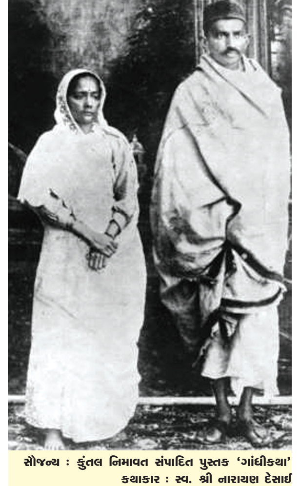
સોજન્ય : કુતલ નિમાવત સંપાદિત પુસ્તક ‘ગાંધીકથા’ કથાકાર : સ્વ. શ્રી નારાયણ દેસાઈ

લોકોમાં ઉત્સાહ હતો, એવો ઉત્સાહ કે જેના કારણે લોકો ગોળી ખાવાય તૈયાર થઈ જતા! વાયવ્યપ્રદેશમાં જ્યાં શસ્ત્રબંધી નહોતી ત્યાં પેશાવરમાં દારૂના પાંચેક પીઠા હતા. ત્યાં સુધી શાંત કૂચ કરીને જવાનું હતું. આ આંદોલનને કડક ઢાંચે ડામી દેવામાં આવ્યું. પોલીસે ગોળીબાર કરીને સત્યાગ્રહીઓને ઢાળી દીધા. એટલી બધી લાશો ઢાળી કે કેટલા લોકો મર્યા તેનો આંકડો જ ન મળી શક્યો. પણ સમાચાર એવા મળ્યા કે મિલીટરીની બે વાન આવીને લાશોને જોગલમાં લઈ ગઈ અને પેટ્રોલ છાંટીને બાળી. જે લોકો મર્યા તેમાં ૮૫ ટકા મુસ્લિમો હતા, પઠાણો હતા! જે લાશો શહેરમાં બચી હતી તેની સંખ્યા ૬૫ની હતી એવું તપાસમાં બહાર આવ્યું. અને સાથે સાથે એ પણ કે એ બધીય લાશોમાં એક બાબત સામાન્ય હતી અને તે એ કે તે સૌએ સામી છાતીએ ગોળી ખાધી હતી. જોઈનેય પીઠમાં ગોળી વાગી હોય એવું બન્યું નહોતું! એ જ રીતે ભારતની મહિલાઓએ પણ બરાબર રીતે અર્હિસક આંદોલનમાં ભાગ લીધો હતો. જે પરાક્રમો ભારતની પારીઓએ દાખવ્યાં તેના અનેક દાખલા છે, પ્રાંતપ્રાંતના દાખલા છે. (કમશ:)