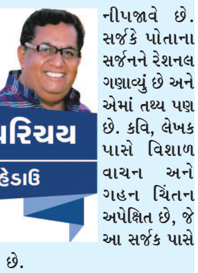
પુસ્તક પરિચય નટવર દેસાઈ

પ્રાચીન કાળમાં ભારતીય ચિંતક ચાર્વાકીય શરૂ કરીને આધુનિક કાળના વિશ્વમાનવ કાર્લ માર્ક્સ, ફ્રેડરિક એંગલ્સ અને લેનિન સુધી ભૌતિકવાદી ચિંતનની એક સ્વસ્થ પરંપરા રહી છે. ભૌતિકવાદના આ પ્રણેતાઓ કે જન્મદાતાઓ નથી પમ તેમણે ભૌતિકવાદી ચિંતન ઉપરથી ધૂળના જાડા થરને સાફ કરવાનું કામ કર્યું છે. આમ જુઓ તો ભૌતિકવાદી ચિંતન માનવજાતિ જેટલું જ પ્રાચીન છે. ભગવદ્ગીતામાં ‘સંશયાત્મા વિનશ્યતિ’ કહીને કૃષ્ણે વેદ અને