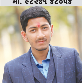
જશજિતસિંહ પ્રેમલાલસિંહ ગોલ