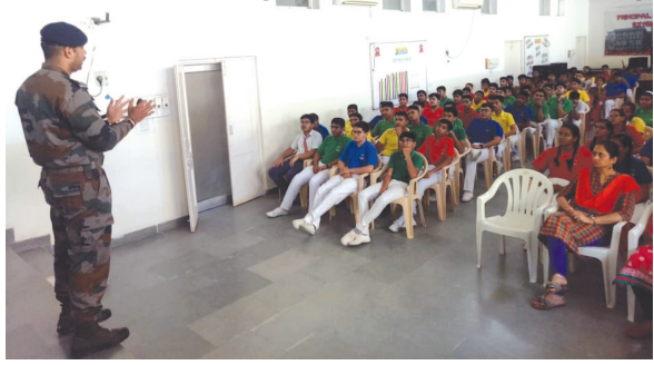
બાલ ઈગલ બ્રિગેડના નેજા હેઠળ આયોજિત ઉપક્રમમાં છ શિક્ષકો ઉપરાંત ૮૫ વિદ્યાર્થીઓ સહભાગી થયા

ગાંધીનગર, તા. ૨ ભારતીય સેનાના સ્ટુડન્ટ આઉટરિચ અભિયાન ૨૦૧૯-૨૦ના ભાગરૂપે ભૂજમાં ૦૧ નવેમ્બરના રોજ આર્મી પબ્લિક સ્કૂલમાં સ્ટુડન્ટ આઉટરિચ પ્રોગ્રામ યોજાયો હતો, જેનું આયોજન બાલ ઈગલ બ્રિગેડના નેજા હેઠળ થયું હતું, જેમાં શાળાનાં છ શિક્ષકો અને ૮૫ વિદ્યાર્થીઓ સહભાગી થયા હતા. આ અભિયાનનો ઉદ્દેશ ભારતીય સેના દ્વારા યુદ્ધ અને શાંતિ એમ બંને દરમિયાન રાષ્ટ્રીય હિતોને એકતરણે જાળવવા માટે હાથ ધરવામાં આવતાં પ્રયાસો અને કટિબદ્ધતા વિશે જાણકારી આપવામાં આવી હતી. આ અભિયાનમાં એવી જાણકારી પણ આપવામાં આવી હતી કે, ભારતીય સેના ફક્ત સંગઠન નથી, પણ જીવન જીવવાની રીત છે, જેમાં રાષ્ટ્રીય હિતોને જાળવવા મૂલ્યોનું જાતન કરવામાં આવે છે. આ પ્રોગ્રામમાં ભારતીય સેનામાં જોડાવા માટેની વિવિધ રીતો પર સંપૂર્ણ લેક્ચરનું આયોજન થયું હતું, જેનાં પરિણામે વિદ્યાર્થીઓને સશસ્ત્ર દળોમાં સામેલ થવા પ્રોત્સાહન આપવામાં આવ્યું હતું. “નેશન ફર્સ્ટ” થીમ પર લેક્ચર પણ યોજવામાં આવ્યું હતું, જેમાં ભારતીય સેના ભારતીયતાનાં વિચારને કેવી રીતે મજબૂત કરે છે અને રાષ્ટ્રીય હિતોને જાળવવા રાષ્ટ્રીય મૂલ્યોનું કેવી રીતે જાતન કરે છે, દેશની એકતા અને અખંડિતતાનું રક્ષણ કેવી રીતે કરે છે, આંતરિક અને બાહ્ય જોખમોને કેવી રીતે દૂર કરે છે તથા સરકાર અને ભારતનાં લોકોને રાષ્ટ્રપ્રેમમાં જોડવાની રીતે સહાય કરે છે એ વિશે જાણકારી આપવામાં આવી હતી.