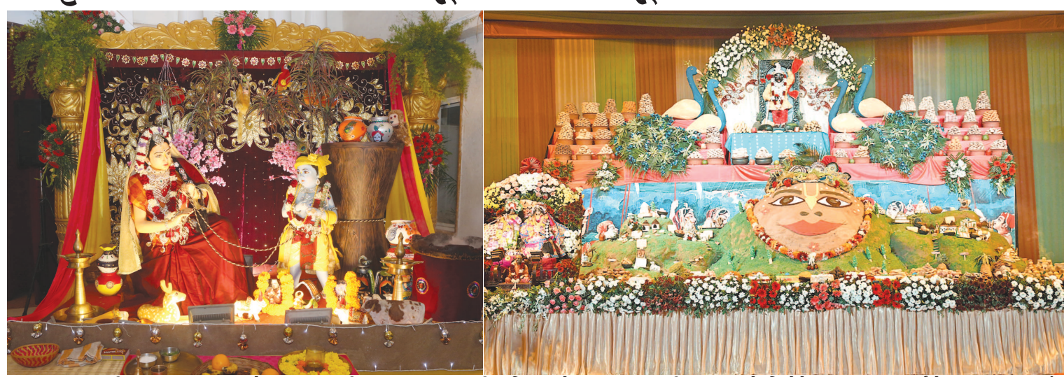
ગાંધીનગર, તા. ૨ ભગવાન શ્રીકૃષ્ણએ ઈન્દ્રના કોષ અને અત્યાચાર સામે વ્રજવાસીઓનું રક્ષણ કરવા પોતાની ટચલી આંગળી પર ગોવર્ધન પર્વત ઉંચક્યો હતો. આ પ્રસંગની યાદગીરી નિમિત્તે કારતક દીપોત્સવ ઉજવવામાં આવે છે. જેના ભાગરૂપે હરેકૃષ્ણ મંદિર, ભાડજ ખાતે ગોવર્ધનપૂજા અને અશકૂટ મહોત્સવ ઉજવવામાં આવ્યો. ૧૦,૦૦૦ થી વધુ ભાવિકોએ ઉપસ્થિત રહીને આ ઉત્સવનો લાભ લીધો હતો. ભગવાન શ્રીકૃષ્ણએ કહ્યું છે કે ગોવર્ધન પર્વત એ પોતાનું એક સ્વરૂપ છે અને મારા સમાન જ પૂજનીય છે. ભગવાન શ્રીકૃષ્ણ કરેલ અમૂર્તકલ્પનારૂપ આ લીલાની યાદગીરી રૂપે હરેકૃષ્ણ મંદિર, ભાડજ દ્વારા વાર્ષિક ગોવર્ધન પૂજા અને અન્નકૂટ મહોત્સવની ઉજવણી મંદિર ખાતે કરવામાં આવી જેમાં આશરે ૧૫૦ કરતા વધુ વધુ જુદા જુદા વ્યંજનો સમાવેશ કરવામાં આવ્યો હતો. ત્યારબાદ સૌને આકર્ષિત અને અતિમોહક ભગવાન શ્રી શ્રી રાધામધવને ભવ્ય “સ્વર્ણરથ” માં શાનદાર સવારી કરાવવામાં આવી જેમાં ભક્તો ભગવાન શ્રી કૃષ્ણના ગુણગાન ગાતા સંકીર્તન ગાઈને જોતા હતા. કેક અને વિવિધ જાતના કૂકીસ, વ્યંજનો વિગેરે દ્વારા બનાવેલ આશરે ૧૦૦૦ કિલોગ્રામ વજન ધરાવનાર ગોવર્ધન પર્વતની પ્રતિકૃતિ સૌના ઉલ્લાસનું કેન્દ્ર બન્યું હતું. ગોવર્ધન પર્વત માટે ઉપયોગમાં લેવાયેલ કેક અને કૂકીસને સંપૂર્ણપણે મંદિરમાં જ ભક્તો દ્વારા બનાવવામાં આવી હતા જે ૧૦૦ ટકા શુદ્ધ અને શાકાહારી હતી. ભગવાન શ્રીકૃષ્ણને ગોપાલ તરીકે પણ પૂજવામાં આવે છે જે ગાયોના

રક્ષણકર્તા છે. ઉત્સવ દરમિયાન ગો-પૂજા પણ કરવામાં આવી હતી. ગાયોને સુંદર રેશમી વસ્ત્રોથી શણગારવામાં આવી અને પરંપરાગત રીતે ગોળ અને કેળા અપર્ણ કરવામાં આવ્યા. ભક્તોએ પણ ગાયની પૂજા-પ્રાર્થના કરી અને ગોવર્ધન પર્વતની પ્રદક્ષિણા હતી. ઉત્સવના અંતમાં કેક અને બીજા વ્યંજનોને ભક્તોમાં પ્રસાદરૂપે વહેંચવામાં આવ્યાં હતાં.