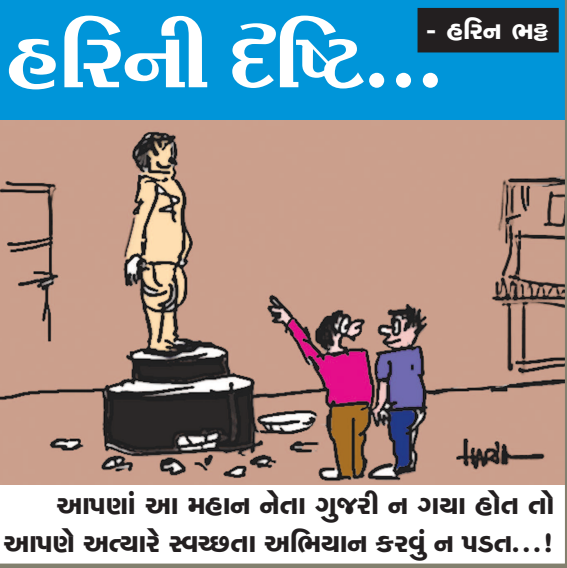
આપણાં આ મહાન નેતા ગુજરી ન ગયા હોત તો આપણે અત્યારે સ્વચ્છતા અભિયાન કરવું ન પડત. ...!