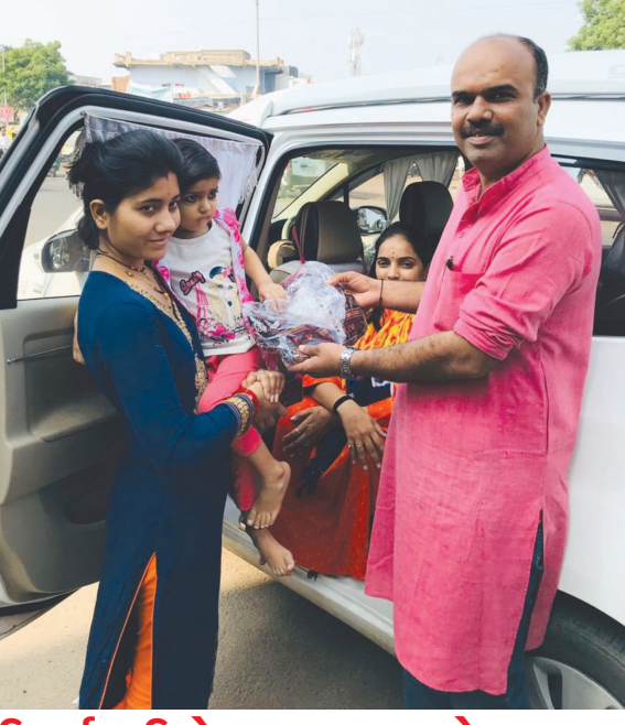
ઉત્કર્ષ ફાઉન્ડેશન ટ્રસ્ટ દ્વારા કેન્સરગ્રસ્ત દર્દીઓને કિટ વિતરણ

નર્મદા તટે સિદ્ધ યોગાશ્રમ ખાતે વીસમી મૌન શિબિર ગાંધીનગરના શ્રી સિદ્ધયોગ સાધન મંડળ દ્વારા નર્મદા પરિક્રમાના પથ પર નદી તટે સ્થિત કરજણ તાલુકાના દેરોલી ગામે સિદ્ધયોગાશ્રમ ખાતે વીસમી મૌન શિબિરનું આયોજન કરવામાં આવ્યું છે. આ શિબિરમાં ૭૭ સાધકો સતત દસ દિવસ સુધી મૌન પાળશે જે કેવળ વાણીનું જ નહીં પરંતુ વાચિક, માનસિક અને સર્વ પ્રવૃત્તિઓનું મૌન રહેશે. સિદ્ધયોગ સાધન મંડળ દ્વારા દર વર્ષે લાભ પાંચમથી પૂનમ સુધી આ રીતે વર્ષમાં એકવાર મૌન શિબિરનું આયોજન કરવામાં આવે છે. જેમાં ૧૮ થી ૭૫ વર્ષની વયના સાધકો ભાગ લે છે. આ વર્ષે યોજાયેલ મૌન શિબિરમાં ૭૭માંથી ૬૦ જેટલા સાધકો યુવા સાધકો છે તેમજ કુલ સાધકોમાં ૩૭ જેટલી મહિલા સાધકો છે. શિબિર દરમિયાન શિબિરાર્થિને તેમજ સ્વયંસેવકોને ભોજનમાં મગ, સલાદ, ખીચડી, થુલી, છાશ જેવો હળવો ખોરાક પીરસવામાં આવે છે જેથી દસ દિવસની શિબિર દરમિયાન સાધકના શરીરમાં રહેલા ઝેરી તત્વો દૂર થઈ શકે અને તેમનું આરોગ્ય સારૂ રહે તેવું સંસ્થાની અખબારી યાદીમાં જણાવાયું છે. આ સાથે જણાવાયું છે કે મૌન શિબિરના કારણે સાધકોનું આખું વર્ષ તરોતાજ પસાર થાય છે તેથી સૌએ એકવાર મૌન શિબિરનો અનુભવ લેવો જોઈએ.