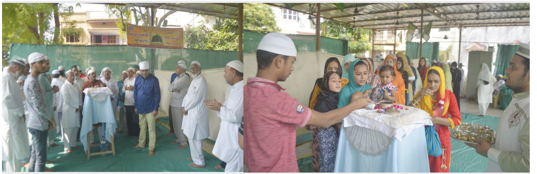
સેક્ટર-૩-બી ખાતે ઈટે મિલાદનો ભવ્ય કાર્યક્રમ યોજવામાં આવ્યો હતો. મોહમ્મદ પયગમ્બર સાહેબના જન્મદિને યોજાવેલા આ કાર્યક્રમમાં મોટી સંખ્યામાં મુસ્લિમ બિરાદરો ઉમટી પડયા હતા.