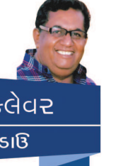
નવાં કલેવર નવર હેડાઉ

મંડપના સળગતા વાંસ પર ચડી ગયો અને સ્કાઉટ ચાકુવડે મંડપની દોરી કાપીને સળગતા ભાગને દૂર હટાવી દીધો. તેમજ મુખ્ય અતિથિને સુરક્ષિત જગ્યાએ પહોંચાડ્યા. ૧૪ નવેમ્બર જેમનો જન્મદિવસ બાળદિન તરીકે ઉજવાય છે તે બાળકોના ધ્યાન નહેરુ ચાચા ખુદ આ બાળકની તત્પરતાને જોઈ રહ્યા. તેઓએ બાળકને પોતાની પાસે બોલાવ્યો અને પુછ્યું, 'જ્યારે આ સળગતી અગ્નિ જવાબાઓમાં સો કોઈ પોતાનો જીવ બચાવવા આમ તેમ ભાગતા હતા ત્યારે તું ખૂબ જ ધીરકપૂર્વક બીજાનો જીવ બચાવવા પ્રયાસ કરતો હતે તેનું શું કારણ?' હરિશ્ચંદ્રે કહ્યું કે, 'મને બીજાની સેવા કરવાનું છે.' પંડિત નહેરુજીએ વિચાર્યું કે દેશમાં વચ્ચે છ વર્ષની ઉંમરના અને અઢાર વર્ષની