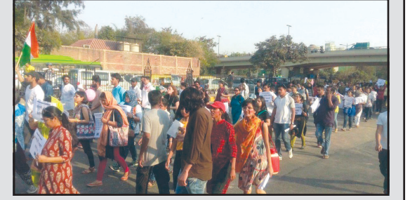
નવીદિલ્હી, તા. ૧૩

ક્લાસમાં પરત ફરવા વિદ્યાર્થીઓને આદેશ કરાયો : ફીમાં વધારો અને અન્ય નિયમો સાથે જોડાયેલા નિર્ણયો પરત લેવાયા : આર્થિકરીતે પછાત વિદ્યાર્થીઓને સહાયતા