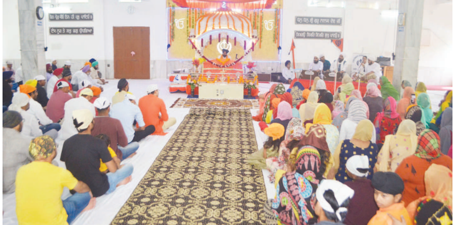
શીખોના પ્રથમ ગુરૂ નાનકટેવની પપ૦મી જન્મ જયંતિ પ્રસંગે વિશ્વભરના શીખ સમુદાયોએ 'પ્રકાશ પર્વ' ઉજવ્યું છે. ગાંધીનગરમાં પણ મંગળવારે ગુરૂનાનક જયંતિએ શહેરના ગુરૂદ્વારામાં વિશેષ ભજન-કીર્તન સાથે દર્શનનો કાર્યક્રમ યોજાયો હતો. અત્રે કૂલોની રંગોળી દ્વારા ગુરૂનાનક દેવના પપ૦માં પ્રકાશ પર્વને સમર્પિત સજાવટ કરવામાં આવી હતી.

આગામી ૧૭મીએ યોજનાર ગોણ સેવા પસંદગી મંડળ દ્વારા કારકુન સંવર્ગની ભરતી માટેની સ્પર્ધાત્મક પરીક્ષામાં ગાંધીનગર જિલ્લાના એક પરીક્ષા કેન્દ્રમાં ફેરફાર કરવામાં આવ્યો છે. ગાંધીનગર શહેરની અશ્વિનભાઈ પટેલ કોલેજ કેમ્પસના બદલે ગોપાલક સેવા કેન્દ્રના શૈક્ષણિક સંકુલમાં આ કેન્દ્ર ખસેડવામાં આવ્યું છે. આજ દિવસે સી.એ.ની પરીક્ષા હોવાથી પરીક્ષા કેન્દ્રમાં આ ફેરફાર કરવામાં આવ્યો હોવાનું તંત્રના સૂત્રોએ જણાવ્યું છે. આ માટે પરીક્ષાર્થીઓને જાણ કરવામાં આવી રહી હોવાનું પણ જાણવા મળેલ છે.