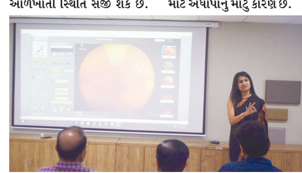
હકીકતમાં ડાયાબિટીક વ્યક્તિઓ આંખમાં અંધાપાનું મોટું કારણ છે.

ગાંધીનગર તા ૧૩ આ અંગે ડો તેજલ દલાલે જણાવ્યું હતું કે જે વ્યક્તિને ડાયાબીટીસ હોય તેમને મોતિયો જામર થવાની શક્યતા ઘણી વધારે જોવા મળતી હોય છે. જેના લીધે આંખનું નિયમિત ચેકીંગ કરાવવું અનિવાર્ય છે. લાંબા સમય સુધી લોહીમાં ગ્લુકોઝનું ઉંચું પ્રમાણ આંખમાં સુક્ષ્મ રક્તવાહિનીઓને નુકસાન પહોંચાડી શકે છે. અને તે ડાયાબિટીક રેટિનોપેથીના નામથી