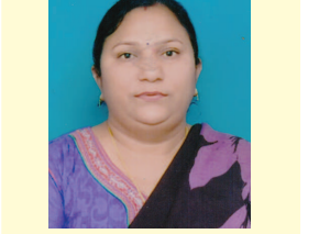
શિવાબેન શાહ લાયોનેસ કલબ