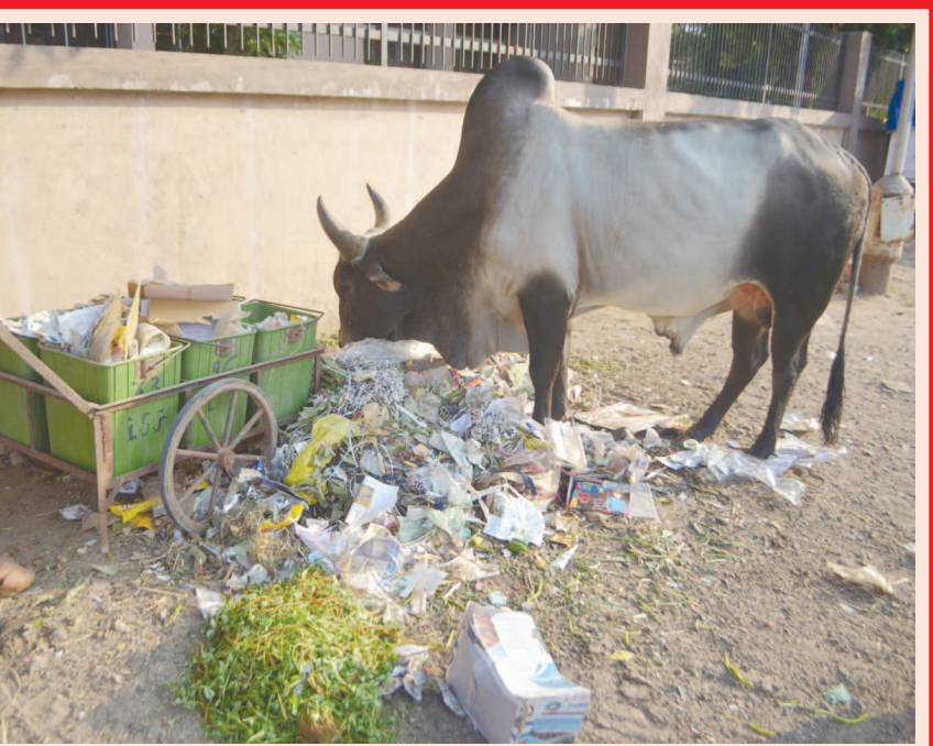
સેક્ટર-૭માં સરદાર વલ્લભભાઈ વિદ્યા મંદિરની પાસે શાકમાર્કેટના ઓટલાની સફાઈ કરવામાં આવે છે પરંતુ સફાઈ કરનાર કર્મચારીઓ લાંબો સમય સુધી ચરનારા ઢગલાંઓને અહીં જ મુકી રાખતા હોવાથી રખડતા ફૂતરાં અને ગાયો કચરાંને વેરવિખેર કરી નાંખે છે.

અમદાવાદ, તા. ૨૨ સુરતમાં છેલ્લા બે દિવસમાં સીટી બસની અડફેટે યારના મોત નીપજ્યા છે. જેનો રોષ હજી શાંત થયો નથી. ત્યારે આજે સતત ત્રીજા દિવસે ફરી નાનપુરા વિસ્તારમાં સીટી બસે રોડ કોસ કરતી એક નિદોષ વૃદ્ધને અડફેટે લીધી હતી. સીટી બસના રોજ રોજના અકસ્માતોના પગલે લોકોમાં હવે ભારોભારો આક્રોશ પ્રવર્તી રહ્યો છે. સીટી બસની ટક્કરથી વૃદ્ધને માથા અને પગના ભાગે ગંભીર ઈજાઓ પહોંચી હતી. જો કે, વૃદ્ધનો જીવ બચી ગયો એ જ મોટી વાત હતી. આ અકસ્માતમાં ઈજાગ્રસ્ત થયેલી વૃદ્ધને હાલ સારવાર અર્થે નજીકની હોસ્પિટલમાં ખસેડવામાં આવી હતી. સીટી બસ (બીઆરટીએસ) બસ દ્વારા રોજ રોજ ગુરતમાં એક પછી એક વિસ્તારોમાં ગંભીર અને જીવલેણ અકસ્માતો સર્જવાના કારણે સુરતવાસીઓ હવે વિકાર્ય છે અને બીઆરટીએસ બસ સેવા બંધ કરવા ઉગ્ર માંગણી ઉઠાવી રહ્યા છે. તો, સુરતવાસીઓની લાગણીને ધ્યાનમાં રાખી કોંગ્રેસ દ્વારા પણ આજે સુરત મનપા ખાતે જોરદાર હલ્લાબોલ કાર્યક્રમ આપવામાં આવ્યો હતો. કોંગ્રેસના સેંકડો કાર્યકરો સુરત મનપાની સ્થાયી સમિતિના બંડની બહાર ધરણાં પર બેસી ગયા હતા અને જોરદાર સૂત્રોચ્ચાર સાથે સુરતમાં