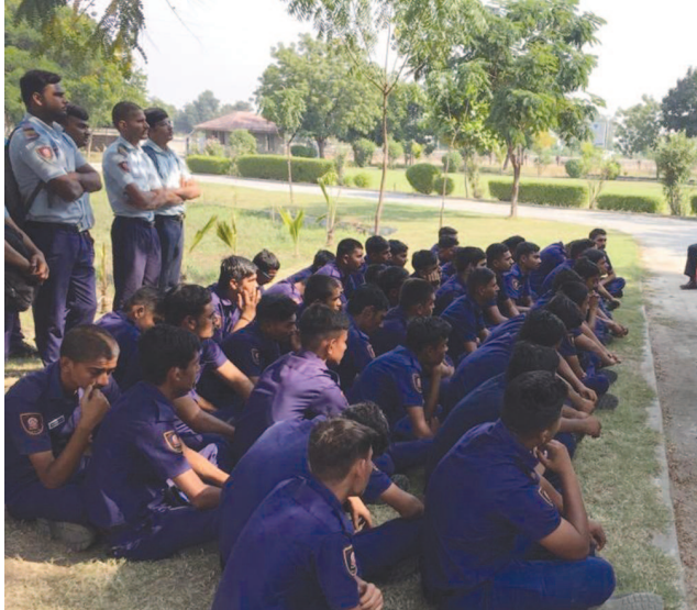
ગાંધીનગર ખાતેની ગુજરાત એનજી ડેવલપમેન્ટ એજન્સી જેડા દ્વારા સાણંદની ઈન્સ્ટિટ્યુટ ઓફ સેફ્ટી એન્ડ ફાયર ખાતે ઊર્જા સંરક્ષણ જાગૃતિ કાર્યક્રમનું આયોજન કરવામાં આવ્યું હતું. જેને નિસર્ગ કોમ્યુનિટી સાયન્સ સેન્ટર દ્વારા સંચાલિત કરવામાં આવ્યો હતો.