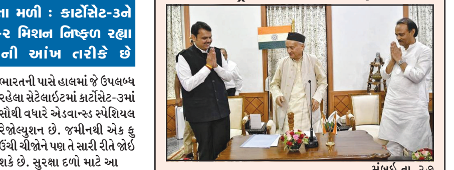
મુંબઈ, તા. ૨૭ અજિત પવારે ભાજપને સત્તા માટે પુરતી સંખ્યા ઉપલબ્ધ કરાવી દેવાની ખાતરી આપ્યા બાદ ભાજપ તેમની વાતમાં આંખ બંધ કરીને વિશ્વાસ કરી લીધો હતો. અહીં પાર્ટીની પ્રતિષ્ઠાને આના કારણે જોરદાર ફટકો પડ્યો હતો. અગાઉ કણ્ટિકમાં પણ પુરતા આંકડા ન હોવા છતાં ભારતીય જનતા પાર્ટીએ સરકાર બનાવી લેવાના પ્રયાસ કર્યા હતા. જેથી તેની પ્રતિષ્ઠાને મોટો ફટકો પડ્યો હતો. હવે મહારાષ્ટ્રમાં પણ તેની આવી જ સ્થિતિ થઈ છે. વર્ષ ૨૦૧૮માં કણ્ટિક વિધાનસભાની ચૂંટણીના પરિણામ જાહેર કરવામાં આવ્યા બાદ પાર્ટી મહારાષ્ટ્રની જેમ જ સૌથી મોટી પાર્ટી બની હતી. જો કે તેમની પાસે પુરતા સંખ્યા ન હતા. તેની પાસે બહુમતિ કરતા સાત સભ્યો ઓછા રહ્યા હતા. ત્યારબાદ ભારતીય જનતા પાર્ટીએ હરિક પાર્ટીના સભ્યોને પોતાની તરફ લાવવા માટેના પ્રયાસ કરવામાં આવ્યા હતા. ભારતીય જનતા પાર્ટીને આશા હતી કે સાત સભ્યો તેને મળી જશે. આ આશા વચ્ચે યેદીયુરપ્પાએ મુખ્યપ્રધાન તરીકે શપથ લઈ લીધા હતા. જો કે પુરતા સંખ્યા ન હોવાના કારણે કલાકોના ગાળામાં જ તેમને રાજીનામુ આપી દેવાની ફરજ પડી હતી. બંને મામલા સુપ્રીમ કોર્ટમાં પહોંચ્યા હતા.

આંકડા ન હોવા છતાં સત્તાના પ્રયાસ કરાયા : કણ્ટિક બાદ મહારાષ્ટ્રમાં પણ પ્રતિષ્ઠાને ફટકો પડ્યો