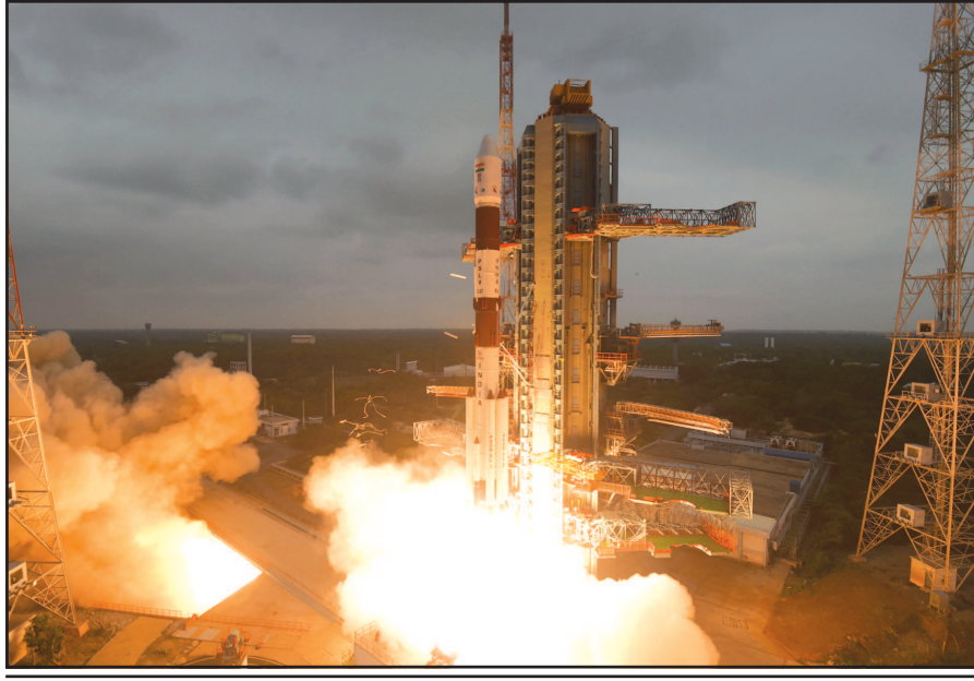
શ્રીહરિકોટા તા. ૨૭ આંધ્રપ્રદેશના શ્રીહરિકોટા સ્થિત ઇસરોના સતીશ ધવન સ્પેસ સેન્ટરથી આજે સવારે ટોપના વૈજ્ઞાનિકો અને ટોપના નિષ્ણાંત અધિકારીઓની હાજરીમાં પીએસએલવીસી-૪૭ને લોન્ચ

કાર્તોસેટ-૩ ઉપગ્રહને લોન્ચ કરીને ઇસરોએ મોટી સિદ્ધિ મેળવી : પીએસએલવીસી-૪૭ મારફતે એક સાથે ૧૪ સેટેલાઇટો લોન્ચ