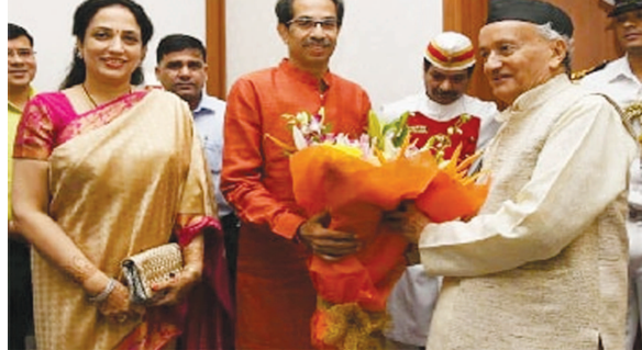
અનુસંધાન પાન-૭ પર

મુંબઈ, તા. ૨૭ મહારાષ્ટ્રમાં એક મહિનાની રાજકીય ઉદયલપાથલ અને અસ્થિરતા બાદ હવે આખરે શિવસેનાના સુપ્રિમો ઉદ્ભવ ઠાકરેના મુખ્યમંત્રીપદે ત્રણ પક્ષોની "મહાવિકાસ અઘાડી" સરકાર બનવા જઈ રહી છે. ઠાકરે આવીકાલે ગુરુવારે મુંબઈમાં દશેરાના દિવસે જ્યાં શિવસેનાનો વાર્ષિક શક્તિ પ્રદર્શનનો કાર્યક્રમ યોજાય છે તે જાણીતા શિવાજી પાર્કમાં સાંજે ૬.૪૦ના મહુર્તમાં મુખ્યમંત્રીપદના શપથ ગ્રહણ કરશે. રાજ્યપાલ ભગતસિંહ કોશિયારી ઠાકરેની સાથે એનસીપીના જયંત પાટિલ અને કોંગ્રેસના બાલાસાહેબ થોરાતને નાયબ મુખ્યમંત્રી તરીકેના અને ૧૫થી ૨૦ મંત્રીઓને પણ શપથ લેવડાવશે. એમ સૂત્રોએ દાવો કર્યો હતો. કહેવામાં આવી રહ્યું છે કે તેમાં શિવસેના, એનસીપી અને