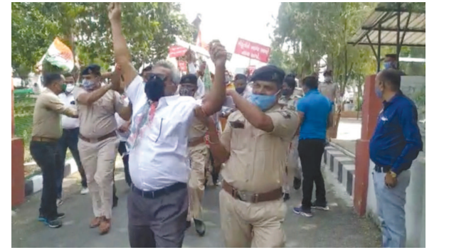
સ્થાનિક સ્વરાજ્યની ચૂંટણીઓ નજીક આવતા વિવિધ

મોડાસા, તા. ૩૧ સરદાર પટેલ અગ્રણીઓ અને કાર્યકર્તાઓની અટકાયત કરી હતી. મોડાસા શહેરના ચાર રસ્તા પર ગુજરાત સહીત સમગ્ર દેશમાં