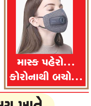
માસ્ક પહેરો... કોરોનાથી બચો...