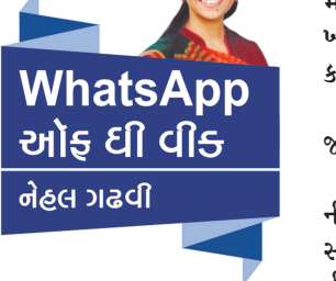
WhatsApp ઓફ ઈ વીડ નેહલ ગઢવી

નેપોલિયન બોનાપાર્ટ સામે આખું યુરોપ ખડું થઈ ગયું હતું. પણ આત્મશ્રદ્ધા હિમાલય જેટલી અડગ હતી. “મારા શબ્દકોશમાં અશક્ય છે - શબ્દ નથી !” એમ કહી. પોતાની સામેના પડકારને ઝીલી લીધો એનો ઈતિહાસમાં કોઈ જોટો નથી. હિમાલયની ટોચ પર પહોંચવું તે કેટલું કપરું કામ છે ? હિલેરી અને તેનસિંગે એ કામ સદેહે પૂરું પાડ્યું. એક એક ડગલું ભરીને એવરેસ્ટ પર પહોંચવાનું હતું. થીઓનો તો પાર નહોતો. પણ આ બંને સાહસવીરો પાસે ધીરજની ઢાલ અને ગાત્મશ્રદ્ધાની તલવાર હતા. આથી એમણે મુસીબતોને મારી હટાવી. આ ધીરજ અને આત્મશ્રદ્ધાનો કોઈ ગાંધી, નેપોલિયન કે તેનસિંગે ઈજારો છો નથી. એ બંને તમારી પાસે છે, મારી પાસે છે અને આપણી સૌની પાસે છે. પણ આપણે એને પારખીને વાપરતા નથી, એનો ઉપયોગ કરતા નથી. - ગોવર્ધનરામ ત્રિપાઠીની સુપ્રસિદ્ધ નવલકથા “સરસ્વતીચંદ્ર પૂરી થતાં વીસ વર્ષ લાગ્યાં હતાં. એમણે કેટલી ધીરજથી કામ કર્યું હશે ! જગતની સત્ અજાયબીઓમાં સ્થાન પામેલો તાજમહલ તૈયાર થતાં પણ વીસ વર્ષ લાગ્યાં હતાં. ચીનની દીવાલ શું રાતોરાત તૈયાર થઈ ગઈ હશે ? દરેક મહાન કાર્ય માણસની ધીરજની કસોટી કરનારું જ હોય છે. કોઈ પણ મહાન કાર્ય ચમત્કારથી થતું નથી. હા, પરંતુ વાઈઝમેન તમે છે એમ, “ચમત્કારો પણ ક્યારેક થાય છે ખરા - પણ તેને માટે માણસને આકરી મહેનત કરવી પડે છે.”