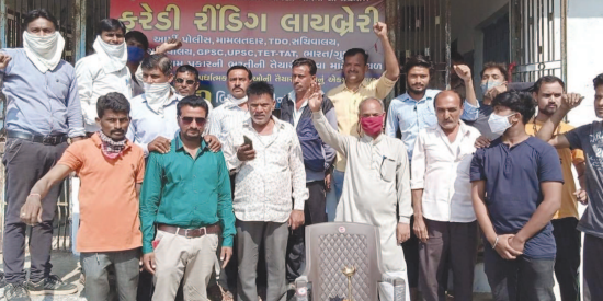
સમયસર પહોંચતું ન હોય ત્યાં યુવાનો સ્પર્ધાત્મક પરીક્ષાઓ માટે યુવાનો-યુવતીઓ માટે લોક સહયોગથી કુદરતી વાતાવરણના થીમ આધારિત ફરેડી રીડિંગ લાયબ્રેરી ખુલ્લી મુકવામાં આવતા સ્પર્ધાત્મક પરીક્ષાની તૈયારી કરતા યુવાન-યુવતીઓમાં આનંદ છવાયો હતો, ગ્રામજનોએ યુવકોની સરાહના કરી હતી. યુવાન એટલે બોલેલું ધારેલું કરવાની શક્તિ જેનામાં રહેલી છે તે યુવાન. કહેવાય છે કે મન હોય તો માળવે જવાય આ કહેવતને સાધક કરતા અરવલ્લી જિલ્લાના મોડાસા તાલુકાના ફરેડી ગામના સરકારી અને ખાનગી શેત્રે નોકરી રાજ્યના વિવિધ દેશોએ નોકરી કરતા યુવાનો લોકડાઉનમાં વનવમાં પહોંચ્યા પછી ગામના વિકાસ અને સમસ્યાઓ માટે ગામના યુવાનો, આગેવાનો અને વડીલોનું "મારું ફરેડી વિકાસશીલ" નામનું વોટસએપ ગ્રુપ બનાવ્યા બાદ દરેક સમાજના ગ્રામજનોને સાથે રાખીને સંકલન કરી વિકાસશીલ કાર્યોની, ગામની સમસ્યાઓ અને ગામના યુવાનો ભવિષ્યમાં આગળ વધવા શું જરૂરિયાત છે તે વિષય પર

મોડાસા, તા. ૮ સોશ્યલ મીડિયાના માધ્યમથી ફરેડી ગામના યુવાનો સૌપ્રથમ એક બીજા સાથે જોડાયા પછી ગામના વિકાસ માટે યુવાનોને સમગ્ર ગામનો સહયોગ મળ્યો, ગ્રામ્ય વિસ્તારોમાં છાપું પછાત