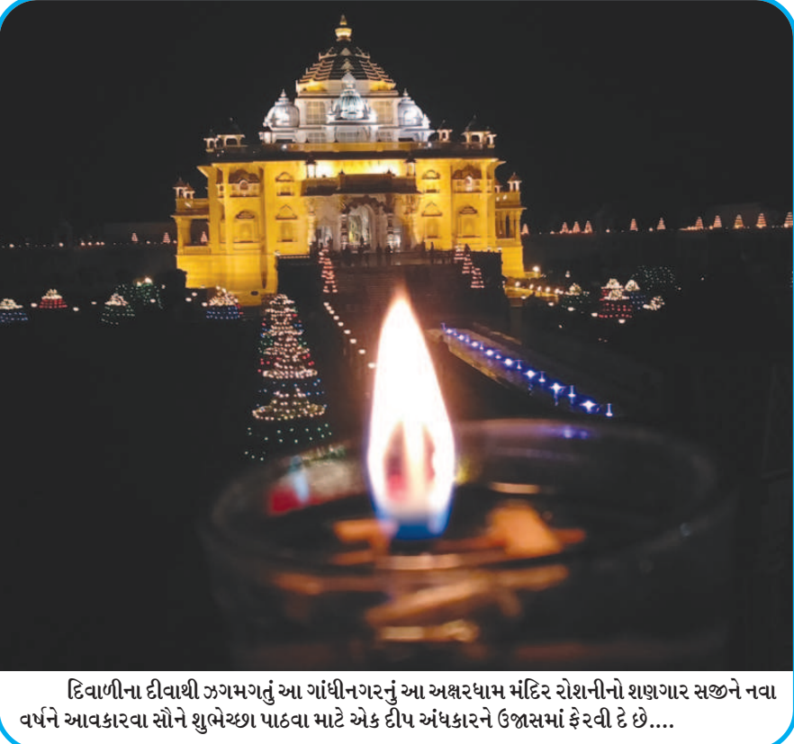
દિવાળીના દીવાથી ઝગમગતું આ ગાંધીનગરનું આ અક્ષરધામ મંદિર રોશનીનો શણગાર સજીને નવા વર્ષને આવકારવા સૌને શુભેચ્છા પાઠવા માટે એક દીપ અંધકારને ઉજાસમાં ફેરવી દે છે....