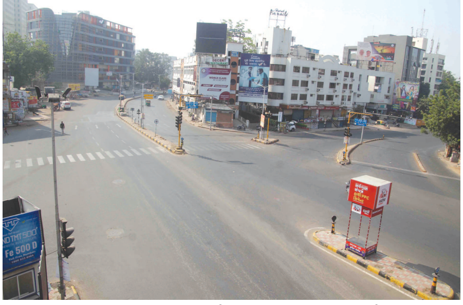
સુસ્ત પાલન કરાવવામાં આવી રહ્યું છે. ઠેર-ઠેર પોલીસકર્મીઓનો

કરવામાં આવ્યા છે. અમદાવાદના એન્ટ્રી પોઈન્ટ્સ પર પણ પોલીસે નાકબંધી કરી દીધી છે. પ્રામ વિગતો