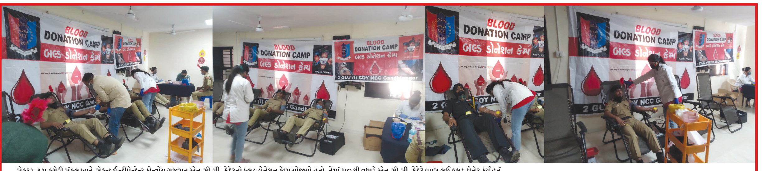
સેક્ટર-૧૫ કચેરી સંકુલ ખાતે સેકન્ડ ઈન્ડીને-નેટ કોન્વોય ગુજરાત એન.સી.સી. કેરેટનો બ્લડ ડોનેશન કેમ્પ યોજાયો હતો. તેમાં ૫૦ થી વધારે એન.સી.સી. કેરેટ ભાગ લઈ બ્લડ ડોનેટ કર્યું હતું

ભારતીય સમય મુજબ ગ્રહણ સ્પર્શ : ૧૨ કલાક ૫૮ મિનિટ ૪૧ સેકન્ડ ગ્રહણ મધ્ય : ૧૫ કલાક ૧૨ મિનિટ ૩૪ સેકન્ડલ ગ્રહણ મોક્ષ : ૧૭ કલાક ૨૫ મિનિટ ૩૨ સેકન્ડલ ગ્રહણ ગ્રાસમાન : ૦. ૨૫૮ રહેશે. એશિયા, ઓસ્ટ્રેલિયા, પેસીફિક અને અમેરિકામાં છાયા ચંદ્રગ્રહણ દેખાવાનું છે ભારતમાં ગ્રસ્તોદય સ્થિતિમાં અલ્હાબાદલ બાલીલ ભાગલપુરલ ભુવનેશ્વરલ બોકારોલ કટકલ ગોરખપુરલ જમશેદપુરલ લખનઉલ પટણા પૂર્વ ભાગમાં આવતા વિસ્તારોમાં નજારો જોવા મળશે જાયા ચંદ્રબિંબની ઉપર થતા બદલાવો ટેલીસ્કોપની મદદથી જાણી લોકોને પ્રકાશના ફેરફારો અંગે જાણકારી આપવાના છે. તેથી ગ્રહણ પાળવું અને ન પાળવું વિગેરે તૂત સદીઓથી