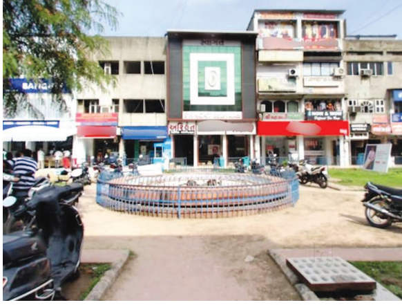
શહેરની જમણે વિચાર કરી રહ્યા છે ત્યારે તે સંબંધિત ખરીદી પણ તેઓ કરવામાં માનતા નથી ત્યારે વિવિધ વેપાર ક્ષેત્રે જોડાયેલા

શહેરમાં તહેવાર બાદ કોરોનાના કેસ એકાએક વધી જવાથી શહેરની જમણે ચિંતામાં મુકાયા છે આજે ધરે ધરે એક કોરોનાનો કેસ તો જોવા મળે જ છે આ ઉપરાંત એજ્યુકેટેડ હોવા છતાં પણ માસ્ક અને સેનીટાઈઝરનો વપરાશ કરવાની તકદારી હજી ઘણા લોકો રાખતા નથી અથવા તો આ બાબતને બહુ સામાન્ય લઈને રોજિંદુ જીવન પસાર કરે છે. ત્યારે કોરોનાના કેસ વધી રહ્યા છે અને શહેર નુકસાની તરફ વળી રહ્યું છે હવે એ જોડું રહ્યું કે વેપારીઓના આ વેપારને લગતા કમાણીના પ્રશ્નો ક્યારે સોલ્વ થાય છે. શહેરની જમણે ધરની બહાર તો ત્યારે જ નીકળી શકશે જ્યારે કોરોનાના કેસ ઓછા થશે. હાલમાં તો પહેલાંની જેમ બહાર નીકળવામાં ઘણું જોખમ છે તેમ શહેરની જમણે જ કહેવું છે.