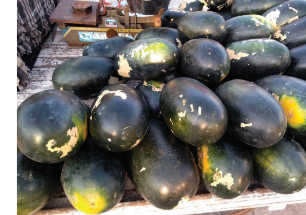
શિયાળો હવે ધીમે ધીમે જામી રહ્યો છે. શિયાળુ ફળો આગમન પણ હવે બજારોમાં થઈ ચુક્યું છે. જો કે ઉનાળુ ફળ ગણાતા તરબુચ હજી બજારોમાં જોવા મળી રહ્યા છે. શિયાળામાં શાકભાજીના શાયે જ ફળો પણ સસ્તા થતા વસાહતીઓને લહેર પડી ગઈ છે.

તા. ૧૩.૦૧.૨૦૨૦ હેઠળ રાજ્ય સરકારના કર્મચારીઓના મોઘવારી ભથ્થામાં પાંચ ટકાનો વધારો કરીને ૧૭ ટકા કરવામાં આવ્યું હતું. પરંતુ તા. ૦૧.૦૭.૨૦૧૯ થી ૩૧.૧૨.૨૦૧૯ સુધીના તફાવતની રકમ ચૂકવવા માટે બાદમાં હુકમો કરવાનું જણાવાયું હતું. આ સંદર્ભે ઉપરોક્ત સમયગાળા દરમિયાન નિવૃત્ત થયેલા સરકારી કર્મચારીઓ દ્વારા અવારનવાર મંડળને આ ચૂકવણી કરવા માટે દરમિયાનગીરી કરવા માટે રજૂઆતો આવી છે. આ ઉપરાંત જાન્યુઆરી-૨૦૨૦ અને તે પછી નિવૃત્ત થયેલ કર્મચારીઓને આનો લાભ મળી