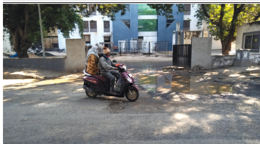
સિવિલ હોસ્પિટલનો પાછળનો રોડ છેલ્લા ઘણા સમયથી તુટી ગયો છે. સતત વરસેલા વરસાદ બાદ રોડની હાલત સાવ બિરમાર થઈ ગઈ છે. આ રોડનું રીપેરિંગ કરવા અને કવાર તબીબો અને હોસ્પિટલ સ્ટાફે રજૂઆત કરી હોવા છતાં તેને રીપેર કરવામાં આવતો નથી.