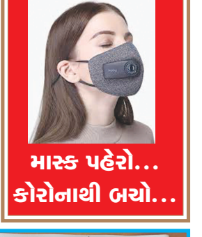
માસ્ક પહેરો... કોરોનાથી બચો...

જન્મદિને વધામણી વિભાગ અંતર્ગત કોઈપણ વાચક પોતાની તસવીરો પ્રકાશન માટે મોકલી શકે છે. પરંતુ, વાચકોને વિનંતી છે કે મોડામાં મોડી આ તસવીરો જન્મદિવસ હોય તેના અગાઉના દિવસે એક વાગ્યા સુધીમાં અખબારને મળી જાય. વાચકો ઈચ્છે તો આ વિભાગમાં પ્રકાશન હેતુ પોતાની તસવીરો અગાઉથી પણ મોકલાવી શકે છે. - સંપાદક