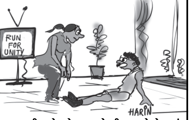
ચાકી ગયો, છોકરાના એડમીશન માટે દોડવાનું, કમાવવા દોડવાનું, પ્રમોશન મેળવવા દોડવાનું, તબીબીયત સારી રાખવા દોડવાનું અને હવે... દેશ માટે પણ દોડવાનું... !!