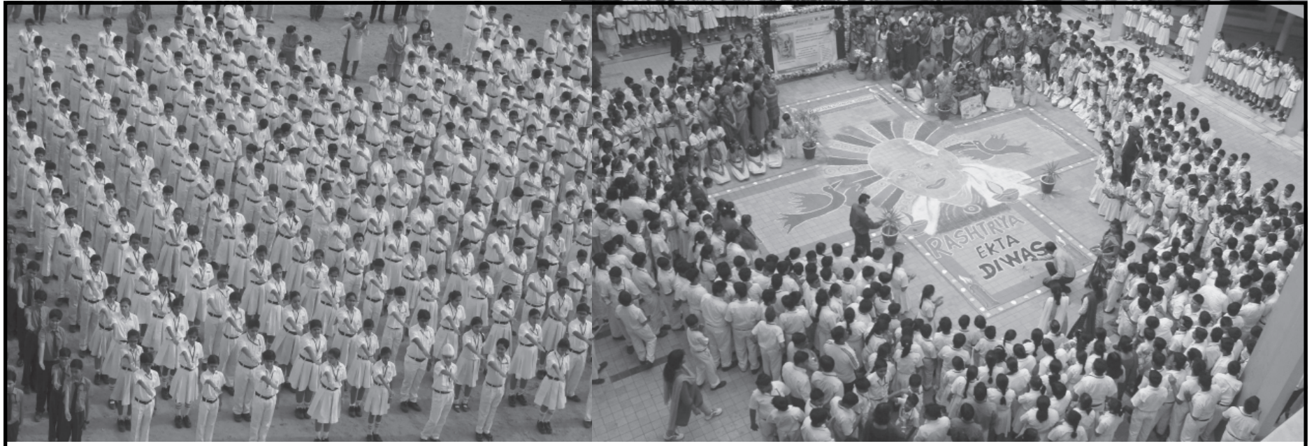
ડીપીએસ ખાતે રાષ્ટ્રીય એકતા દિવસ ઉજવાયો દિલ્હી પબ્લિક સ્કૂલ ગાંધીનગર ખાતે દેશમાં સરદાર પટેલની જન્મ જયંતિ નિમિત્તે ૨૦ ફોર યુનિટી અંતર્ગત દોડ યોજવામાં આવી હતી. જેમાં હિલવુડ સ્કૂલ ગાંધીનગરના વિદ્યાર્થીઓ જોડાયા હતા. દેશના વડાપ્રધાન નરેન્દ્રભાઈ મોદીએ લોખંડી પુરુષ સરદાર વલ્લભભાઈ પટેલની જન્મ જયંતિને એકતા દિવસ તરીકે જાહેર કર્યો છે ત્યારે દેશના અનેક રાજ્યોમાં જે અન્વયે ૨૦ ફોર યુનિટીનું આયોજન કરવામાં આવ્યું હતું. આ કાર્યક્રમ અન્વયે ગાંધીનગરની હિલવુડ સ્કૂલ અને આચાર્ય મહાપ્રજ્ઞ સ્કૂલના વિદ્યાર્થીઓએ પણ ડીપીએસ દ્વારા આયોજીત '૨૦ ફોર યુનિટી'માં ભાગ લીધો હતો. ત્યારબાદ શાળામાં વિવિધ સ્પર્ધાઓ યોજવામાં આવી હતી જેવી કે પોસ્ટર મેકિંગ, વક્તવ્ય સ્પર્ધા અને ઓન લાઈન કવીટ સ્પર્ધા. ડીપીએસ ગાંધીનગરના શિક્ષકો દ્વારા સરદાર સાહેબની ભવ્ય રંગોળી પણ બનાવવામાં આવી હતી.