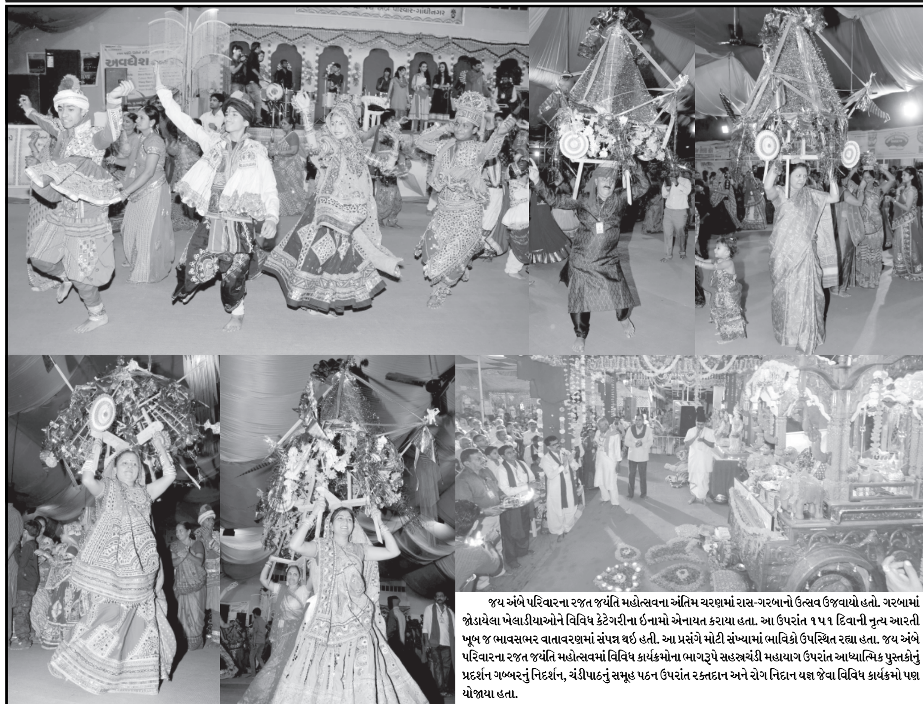
જય અંબે પરિવારના રજત જયંતિ મહોત્સવના અંતિમ ચરણમાં રાસ-ગરબાનો ઉત્સવ ઉજવાયો હતો. ગરબામાં જોડાયેલા ખેલાડીઓને વિવિધ કેટેગરીના ઈનામો એનાયત કરાયા હતા. આ ઉપરાંત ૧૫૧ દિવાની નૃત્ય આરતી ખૂબ જ ભાવસભર વાતાવરણમાં સંપન્ન થઈ હતી. આ પ્રસંગે મોટી સંખ્યામાં ભાવિકો ઉપસ્થિત રહ્યા હતા. જય અંબે પરિવારના રજત જયંતિ મહોત્સવમાં વિવિધ કાર્યક્રમોના ભાગરૂપે સહસ્ત્રોંડી મહાયાગ ઉપરાંત આધ્યાત્મિક પુસ્તકોનું પ્રદર્શન ગબ્બરનું નિદર્શન, ચંડીપાઠનું સમૂહ પઠન ઉપરાંત રક્તદાન અને રોગ નિદાન યજ્ઞ જેવા વિવિધ કાર્યક્રમો પણ યોજાયા હતા.