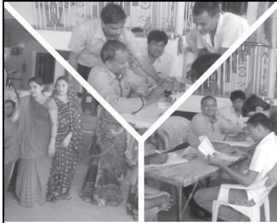
ધનસુરા નજીક હિરાખાડી કંપામાં મોડાસાની નવચેતન પેથોલોજી લેબોરેટરી અને રામાણી મેમોરીયલ બ્લડ બેંક તરફથી નિઃશુલ્ક હેલ્થ ચેક-અપ કાર્યક્રમ યોજાયો હતો. આ હેલ્થ ચેકઅપમાં થેલેસેમીયા અવેરનેશ, હેલ્થ અવેરનેશ, બ્લડ ગ્રુપીંગ, ડાયાબીટીસ અવેરનેશ અને ટેસ્ટ કરવામાં આવ્યા હતા. જેમાં મોટી સંખ્યામાં ગ્રામજનો જોડાયા હતા.