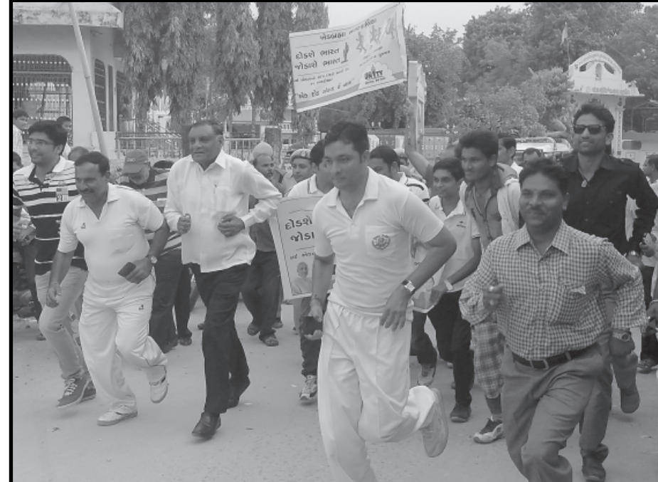
ખેડબ્રહ્મામાં એકતા દોડ યોજાઈ ખેડબ્રહ્મા નગરપાલિકાના સેવા સદન ખાતેથી સરદાર વલ્લભભાઈ પટેલ જન્મ જયંતિ નિમિત્તે ૨૦ ફોર યુનિટી દોડનું આયોજન કરવામાં આવ્યું હતું. આ એકતા દોડનું સેવા સદન ખાતેથી પ્રસ્થાન ખેડબ્રહ્મા એ.પી.એમ.સી.ના ચેરમેન લીલી ઝંડી આપી કરાવ્યું હતું. બાદ સર્વે મહાનુભાવોએ સરદાર પટેલની પ્રતિમાને સુતરની આટી પહેરાવી એકતા માટેના સંકલ્પ લીધા હતા. કાર્યક્રમમાં મોટી સંખ્યામાં નગરજનો ઉપસ્થિત રહ્યા હતા.