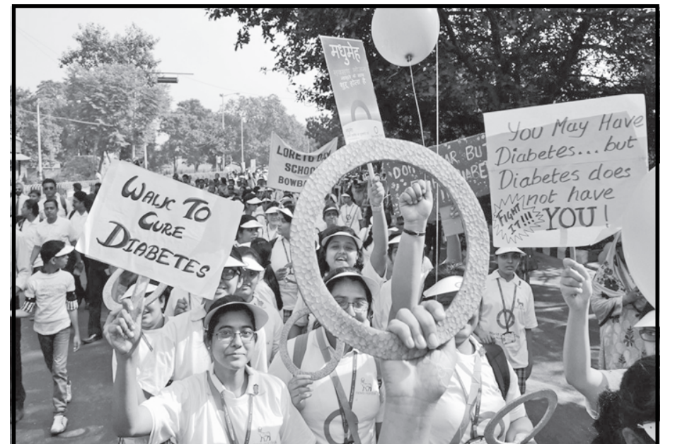
કોલકાતા ખાતે વિશ્વ ડાયાબીટીસ દિવસ નિમિત્તે યોજાયેલી એક રેલીમાં શાળાના બાળકોએ ડાયાબીટીસના પ્રતિક તરીકે 'બ્લ્યુ રીંગ' અને તે અંગે જાગૃતિ લાવવા 'પ્લે કાર્ડ' દર્શાવ્યા હતાં.

બેંક બંધો માટે અમે અરીજ આમંત્રિત કરીશું. નાબાર્ડ દ્વારા આયોજિત એક કાર્યક્રમમાં તેમણે આ મુજબની વાત કરી હતી. રાજને ગયા વર્ષે આરબીઆઈના વડા તરીકેની જવાબદારી લીધી હતી. રીઝર્વ બેંકે અગાઉ ઈન્ફ્રા ધીરાણદાર આઈડીએફસી અને માર્કેટો ધીરાણદાર બંધનને લાયસન્સ આપ્યા હતા. જો તમામ દરખાસ્ત સ્વીકારી લેવામાં આવશે તો સામાન્ય લોકોને પણ સીધો ફાયદો થઈ શકશે. ખાસ કરીને ઓછી આવક ધરાવનાર અને નાના વેપારીઓને રાહત થશે.