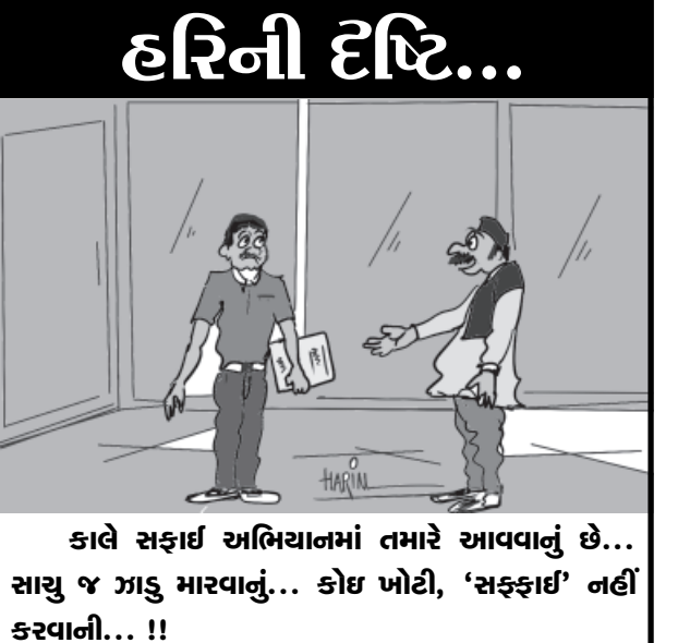
કાલે સફાઈ અભિયાનમાં તમારે આવવાનું છે... સાચું જ ઝાડુ મારવાનું... કોઈ ખોટી, 'સફાઈ' નહીં કરવાની... !!

અમલી બનાવવામાં આવ્યો છે. આજે ગુણોત્સવના દ્વિતીય દિવસે કાયદો અને ન્યાયતંત્ર વિભાગના રાજ્ય મંત્રી શ્રી -દિપસિંહ જાડેજાની ઉપસ્થિતિમાં ગાંધીનગર તાલુકાના આદરજ મોટી ગામની -થથમિક કન્યા શાળામાં ગુણોત્સવનો કાર્યક્રમ આવી ગયા હતા. રાખેતા મુજબ શાળામાં યોજાતી નર્થના, -તિજા અને રાષ્ટ્રગીતના ગાનમાં મંત્રીશ્રી જોડાયા હતા. ત્યાર બાદ મંત્રી શ્રી -દિપસિંહ જાડેજા ધોરણ-૬ના વર્ગખંડમાં ગયા હતા. ત્યાં આગળ તેમની ઉપસ્થિતિમાં વર્ગખંડના એક ક્લાસમાં બે શિક્ષકો દ્વારા બાળકો પર દેખરેખ રાખવામાં આવે છે, તેમ આજે ધોરણ-૬ની વિદ્યાર્થીનીઓ પર વર્ગ શિક્ષક અને મંત્રીશ્રીએ પરીક્ષાનું સુપરવિઝન કર્યું હતું. તે પછી તેમણે ધોરણ-૭ અને ૮ના વર્ગખંડની પણ મુલાકાત લીધી