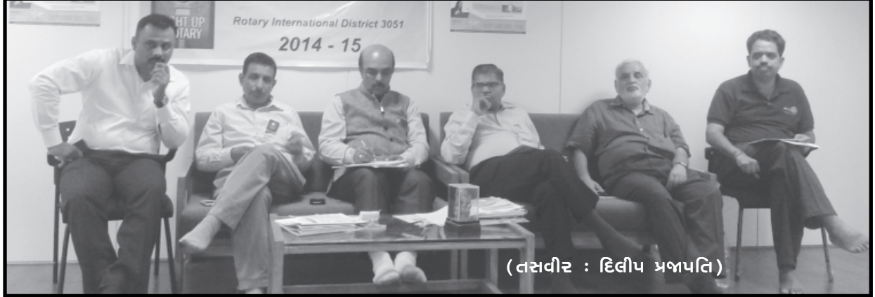
અસરકારક નેતૃત્વ ઉભુ કરીને વિશ્વને ઉજ્જવલિત ચાલશે. જેમાં યુવક-યુવતિઓને વિષય ચાલતી અલગ-અલગ વ્યવસ્થાની ચર્ચા વિચારણા સુવિધાને બહેતર કેવી રીતે બનાવી શકાય તે માટેના