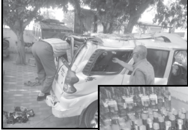
પાલનપુર નજીક આવેલ પારપડા માર્ગ પરથી શહેર તરફ આવતી વિદેશી દારૂ ભરેલી ગાડીનો ફિલ્મી ઢબે પીછો કરી ઝડપી પાડી હતી પોલીસે દોઢ લાખનો દારૂ અને કાર કબજે કરી વધુ તપાસ હાથ ધરી છે.

પાલનપુર, તા. ૨૨ સ્કોર્પીયો પસાર થઈ રહી હતી વહેલી