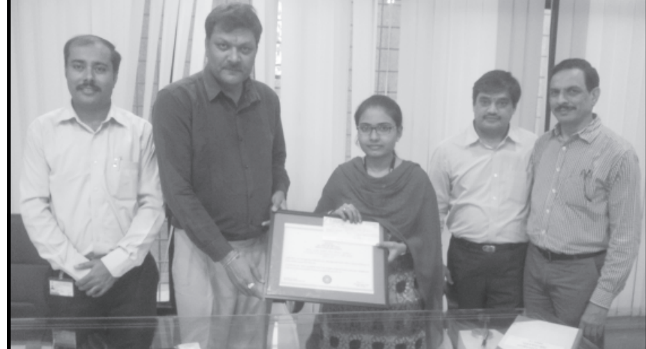
ખેલ મંત્રાલય ભારત સરકાર દ્વારા અપાતો એવોર્ડ કડી કોલેજ સતત બીજા વર્ષે મેળવ્યો