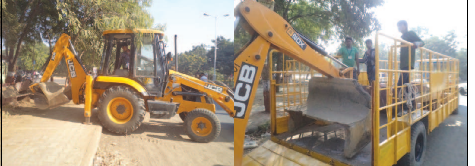
બાકડા હટાવ સુંબેશ : ગાંધીનગર શહેરમાં પાલિકા દ્વારા અને કોર્પોરેટરની ગ્રાન્ટમાંથી વિવિધ સ્થાનો પર બાકડા મુકવામાં આવ્યા હતા. નગરમાં મુકાયેલા બાકડા સમયની સાથે સાથે તૂટવા પણ માંડ્યા હતા. શહેરમાં વિવિધ સ્થાનોએથી આવા તૂટેલા બાકડા હટાવવાની કામગીરી હાલ પૂરજોશમાં ચાલી રહી છે... પ્રથમ તબક્કામાં મુખ્ય રસ્તાઓ પરથી બાકડા હટાવાશે, ત્યારબાદ સેક્ટરોના આંતરિક માર્ગો પરથી હટાવવાની સુંબેશ કાર્યરત રહેશે.