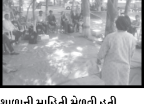
શાળાની માહિતી મેળવી હતી.

ગાંધીનગર, તા. ૨૭ ગાંધીનગર પાસે આવેલ ભાટ ખાતે રોટરી ક્લબ દ્વારા આઈ રાયલા કાર્યક્રમ યોજવામાં આવી રહ્યો છે. જેમાં ૧૭ દેશોના પ્રતિનિધિઓએ ભાગ લીધો છે. પ્રતિનિધિઓએ રાજપુર ગામની મુલાકાત લીધી હતી.