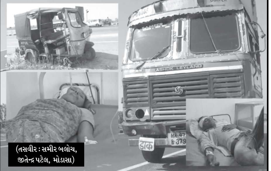
મોડાસા ખાતે આવેલી બાયપાસ ચોકડી પર આજે ટ્રક અને પેસેન્જર રીક્ષા વચ્ચે અકસ્માત સર્જતા ૧૦૦ થી વધારે લોકો ઘાયલ થયા છે આ તમામને ૧૦૮ ઈમ્બ્યુલન્સ દ્વારા તાત્કાલીક સારવાર અર્થે મોડાસા ની સાર્વજનિક હોસ્પિટલ માં ખસેડવામાં આવ્યા હતા જેમાં થી હેક ની હાલત ગંભીર હોવાનું ડોક્ટરો દ્વારા જણાવા માં આવ્યું હતું સદભાગ્યે આ અકસ્માત કોઈ ને જાનહાનીથી થઈ નહોતી જ્યારે પોલીસે ગુનો નોંધી આગળની કાર્યવાહી હાથ ધરી હતી.

અનુસંધાન છેલ્લાનું ચાલુ ઉત્પાદન વધુ છે આમ છતાં ગ્રાહકોને સસ્તુ દૂધ મળતું નથી. એમાંય છેલ્લા બે વર્ષથી તો દૂધમાં ભાવ એટલી વખત વધ્યા છે જેટલી વખત ડીઝલ-પેટ્રોલના ભાવ ઘટ્યા છે! આજથી બે-ત્રણ વર્ષ પહેલાં અમૂલ ગોલ્ડની થેલી ૧૪ થી ૧૫ રૂપિયે મળતી હતી તેનો આજનો ભાવ ૨૩ રૂપિયા છે અને અમૂલ તાઝા જે -૮ રૂપિયે મળતું તેના ૧૭ રૂપિયા આપવા પડે છે. છાશ પણ હવે ફૂડી ફૂડીને પીવી પડે તેમ છે. પાંચ રૂપિયાનું છાશની થેલીને હવે ૧૦ થી ૧૧ રૂપિયા આપવા પડે છે. ઉત્પાદન અપાર છતાં ટીપાં દૂધ રૂપિયા આપવા પડે છે. ઉત્પાદન અપાર છતાં ટીપાં દૂધ માટે ગરીબનાં છોટું ટટળે એને શ્વેતકાંતિ કહેવાય? મધ્યમવર્ગના પરિવારોને દૂધ લેવા ઘરનાં અન્ય બજેટમાં કાપ મુકવો પડે તેવી હાલત હોવા છતાં શ્વેતકાંતિની વાતો જ કરવાની..! શ્વેતકાંતિના નામે મધ્યમ વર્ગીય પરિવારોની હાંસી ઉડાવતી હોય તેમ દેનિક જરૂરિયાતની ચીજવસ્તુ દૂધ-છાશના ભાવ એટલા વધારી દેવાયા છે કે દૂધની જરૂરિયાતને પહોંચી વળવા મધ્યમવર્ગીય પરિવારોને બજેટ પર કાપ મુકવો પડે છે. અથવા દૂધનો વપરાશ ઘટાડવો પડે છે. બાળકો અને મહિલાઓમાં કુપોષણનું પ્રમાણ વધું છે. દૂધ ઉત્પાદન વધુ છે તો તેનો લાભ ભાવમાં ઘટાડો કરી મધ્યમ અને ગરીબ વર્ગ સુધી પહોંચાડવામાં આવતો નથી. ઉત્પાદન વધે તેમ ભાવ ઘટે તે તેવું સાદુ અર્થશાસ્ત્ર દૂધને કેમ લાગુ પડતું નથી. ડીઝલના ભાવો વધ્યા ત્યારે ભાવોનું બહાનુ આગળ કરી દૂધના ભાવો વધારી દેવાયા હતા હવે જ્યારે ડીઝલનો ભાવ ઘટ્યો છે તો દૂધના ભાવમાં કેમ એક-બે રૂપિયાનો ઘટાડો કરવામાં આવતો નથી તે મધ્યમવર્ગીય પરિવારોને સમજાતું નથી.