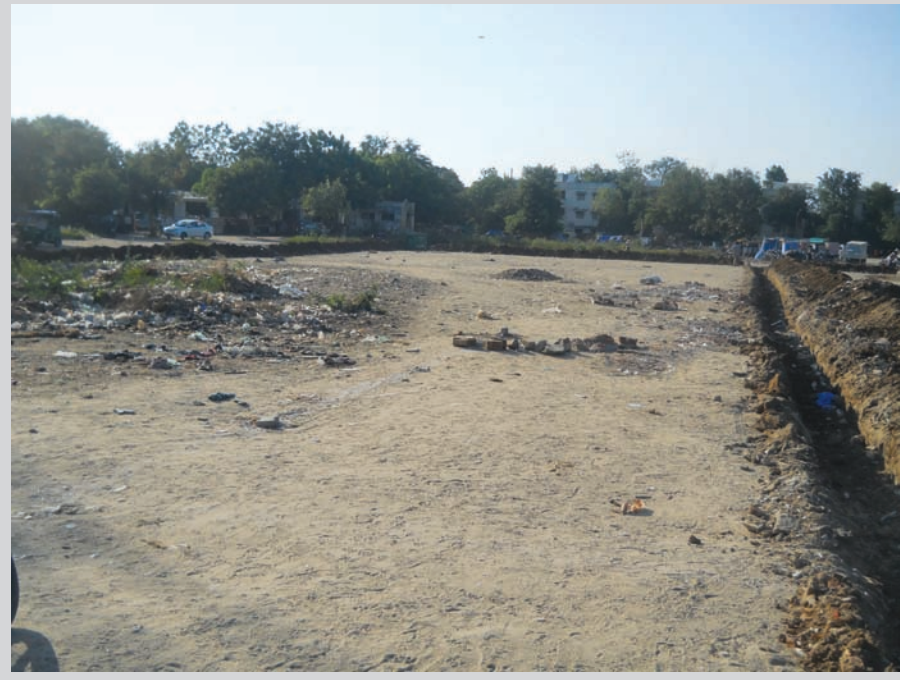
સરકારી પ્લોટ પર કડીયાનાકું ભરાય છે. સવારે મોટી સંખ્યામાં લોકો હાજર રહેતા મેળા જેવો માહોલ સર્જાય છે. અહીં નગરવાસીઓને પ્લમ્બર, વાયરમેન, કડીયા, મજૂર, રેતી, સહિત બાંધકામ ક્ષેત્રે સંકળાયેલા લોકો હાજર સ્ટોકમાં મળી રહે છે. નગરજનો પણ જયારે તેમને કારીગરોની જરૂર હોય ત્યારે અહીં આવીને લઈ જતા હતા. એકજ સ્થળેથી કારીગરો મળતા નગરજનોને પણ સરળતા રહે છે.

ઉભા રહેતા હજારો કારીગરો અને શાકના વેપારીઓને અન્યત્ર સ્થળે શિફ્ટ થવું પડશે. આગામી સમયમાં આ પ્લોટ પર અધ્યતન નવિન બિલ્ડીંગ ઉભુ થશે. નગરજનોની અવરજવર વધતા આ ધ-૨ વિસ્તારમાં ભરચક બની રહેશે. સેક્ટરના વસાહતીઓની વર્ષોજુની કડીયાનાકું હટાવવાની માંગ હતી. પરંતુ હવે કડીયાનાકાનું સરનામું બદલાતા વસાહતીઓ પણ રાહતનો શ્વાસ લેશે. શહેરમાં ખાલી પડેલા સરકારી પ્લોટ પર કડીયાનાકું ભરાય છે. સવારે મોટી સંખ્યામાં લોકો હાજર રહેતા મેળા જેવો માહોલ સર્જાય છે. અહીં નગરવાસીઓને પ્લમ્બર, વાયરમેન, કડીયા, મજૂર, રેતી, સહિત બાંધકામ ક્ષેત્રે સંકળાયેલા લોકો હાજર સ્ટોકમાં મળી રહે છે. નગરજનો પણ જયારે તેમને કારીગરોની જરૂર હોય ત્યારે અહીં આવીને લઈ જતા હતા. એકજ સ્થળેથી કારીગરો મળતા નગરજનોને પણ સરળતા રહે છે. લારીઓ લઈને મોટીસંખ્યામાં અહીં ઉભા રહે છે. આસપાસના સેક્ટરોના વસાહતીઓ સાંજે શાક માર્કેટના વેપારીઓને અન્યત્ર જગ્યા શોધી પડશે. ધ-૨ વિસ્તારમાં નવા અધ્યતન બિલ્ડીંગ બનતા નવો કારીગરો શોધવા તેમજ સાંજે શાકભાજી ખરીદવા આવતા નગરજનોને પણ નવા સરનામે જવું પડશે. ધ-૨ વિસ્તારમાં નવા અધ્યતન બિલ્ડીંગ બનતા નવો