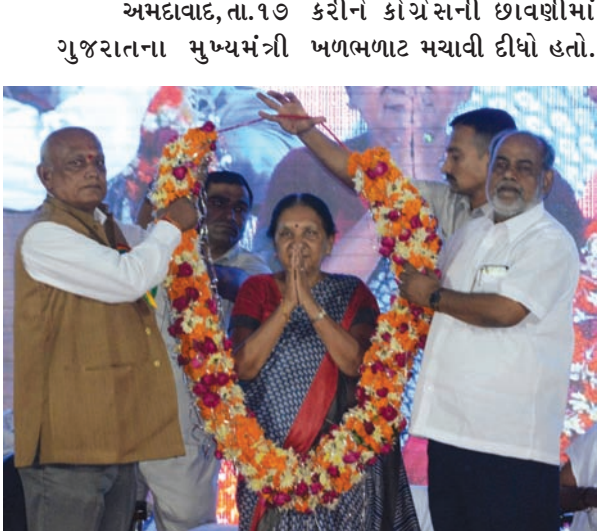
આનંદીબેન પટેલે આજે અમદાવાદ શહેરમાં ઝંઝાવતી ચુંટણી પ્રચાર

સવારે ૧૦ વાગ્યાથી મુખ્યમંત્રીના રોડ શોના કાર્યક્રમની શરૂઆત : ઠેર-ઠેર માનવ મહેરામણ ઉમટ્યો : હાર જોઈ કોંગ્રેસ ભયભીત છે : આનંદીબેન પટેલ