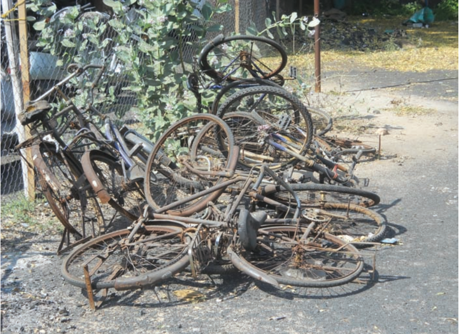
સાયકલનો ભંગાર - ગાંધીનગર એસ.ટી. ડેપોના પાર્કિંગમાં છેલ્લા ઘણા સમયથી સાઈકલોનો ભંગાર પડી રહ્યો છે... આ ભંગારનું કોઈ રણીધણી હોય એમ લાગતું નથી... આ ભંગાર ક્યાંથી આવ્યો અને કેવી રીતે આવ્યો એ પણ એક ચર્ચાનો વિષય બની રહ્યો છે... અંતે તો તંત્ર દ્વારા આ ભંગારના નિકાલ માટેની વ્યવસ્થા કરવી જોઈએ એવી લોકલાગણી પ્રવર્તી રહી છે... જોઈએ શું થાય છે આ ભંગારનું...

જુનિયર અન્ડર ઓફિસરની ફરજ બજાવી રહ્યો છે. અગાઉ વડોદરા અને પશ્ચિમ બંગાળ ખાતે યોજાયેલ જી.વી. માવલંકરના આખા ભારતમાં તેણે ૪થું સ્થાન પ્રાપ્ત કર્યું હતું. આગામી ડિસેમ્બર માસની તા. ૧ લીથી ૧૫મી તારીખ દરમિયાન ૨૫મી ઓલ ઈન્ડિયા એર રાયફલ નેશનલ ચેમ્પિયનશીપ યોજાશે. જેમાં ગુજરાત એનસીસીના ૪ ખેલાડીઓમાં પસંદગી પામીને પરાગે ગાંધીનગર જિલ્લાનું ગૌરવ વધાર્યું છે.