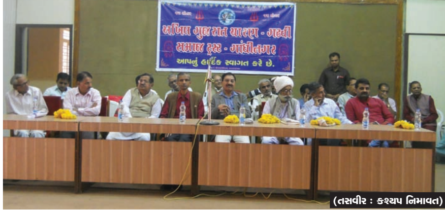
એમિલિન - સન્માન સમારોહ - અખિલ ગુજરાત ચારણ-ગઢવી સમાજ ટ્રસ્ટ દ્વારા દર વર્ષની જેમ આ વર્ષે પણ સમાજનો સ્નેહમિલન કાર્યક્રમ અને તેજસ્વી તારલાઓનો સન્માન કાર્યક્રમ યોજવામાં આવ્યો હતો. સ્ટાફ ટ્રેનીંગ કોલેજ ખાતે યોજાયેલા આ કાર્યક્રમમાં સમાજના અગ્રણીઓ અને પરિવારજનો મોટી સંખ્યામાં ઉપસ્થિત રહ્યા હતા.