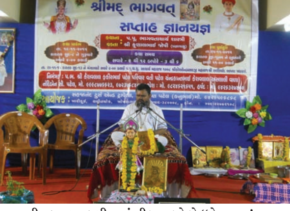
શ્રીમદ્ ભગવદ્ ગીતામાં શ્રીકૃષ્ણ કહે છે "હે માનવ ! પ્રથમ તુ તારા જીવનમાં ધર્મની રક્ષા કર, સમય આવે ધર્મ જ તારી રક્ષા કરશે" આવા તો અનેક જીવનલક્ષી અદ્ભુત ઉપદેશો આ મહાગ્રંથમાં સંઘરાયેલા પડ્યાં છે. જે વખતોવખત મનુષ્યને જીવનના કઠિન માર્ગે આવતી અંધકારની અડચણોમાં જ્ઞાનરૂપી પ્રકાશ પાડી પથદર્શન કરતા