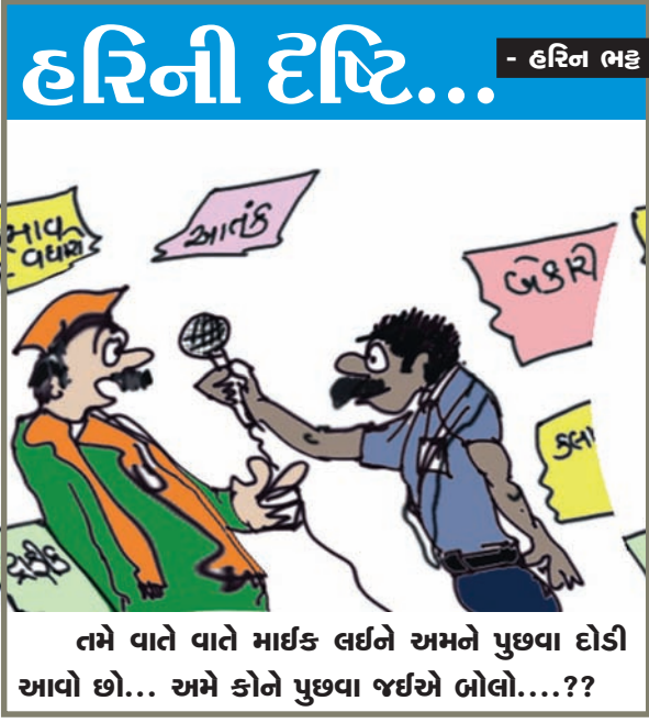
તમે વાતે વાતે મારફત લઈને અમને પુછવા દોડી આવો છો... અમે કોને પુછવા જઈએ બોલો...??