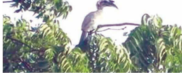
કારણોસર આ પક્ષીએ ગાંધીનગર જિલ્લાને પોતાના નિવાસસ્થાન તરીકે પસંદ કરતા હવે શહેર સહિત જિલ્લામાં તેની હાજરી ઉડીને આંખે વળગે તેટલી

તરીકે પસંદ કરી રહ્યો છે જેના કારણે પક્ષી પ્રેમીઓ રાજીના રેડ થઈ જવા પામ્યાં છે. પક્ષી પ્રેમીઓમાં ઈન્ડિયન ગ્રે હોર્નબિલ અને સામાન્ય જનજીવનમાં 'ચિલોત્રો' નામથી પ્રસિદ્ધ આ પક્ષી અત્યાર સુધી સાબરકાંઠા-મહેસાણા વગેરે જિલ્લામાં મોટા પ્રમાણમાં જોવા મળતું હતું પરંતુ ગાંધીનગરમાં તેની હાજરી નહિવત પ્રમાણમાં હતી. જોકે છેલ્લા કેટલાક સમયથી કોઈ અગમ્ય