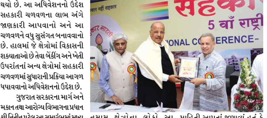
તમામ ક્ષેત્રોના લોકો આ અધિવેશનમાં હાજરી આપી રહ્યા છે. "આ ૩ દિવસના અધિવેશન આ અધિવેશનની પેઠિડ કોન્ફરન્સ માત્ર તેહસીલ અને નેશનલ લેવલના કાર્યકર્તાઓ પૂરતી સિમીત રખાઈ છે. સહકારી ક્ષેત્રને ખાનગી ક્ષેત્રની સંસ્થાઓ સાથે જોડવાનો ઈરાદો ધરાવતા સૂચિત વિષયક સહિત આ ચળવળમાં જોડવા માગીએ છીએ. નડતરરૂપ મુદ્દાઓ અંગે ઠરાવ કરવાનું સહકાર ભારતીનું આયોજન છે. સહકાર ભારતી હાલમાં ૨૭ રાજ્યોના ૪૧૧ જિલ્લામાં કામગીરી ધરાવે છે. સહકાર ભારતીના નેશનલ વાર્ષિક પ્રેસીડેન્ટ શ્રી જ્યોતિન્દ્ર મહેતાએ આ અધિવેશન અંગે સહકાર ભારતીના નેશનલ પ્રતિનિધિત્વ કરતા આશરે ૨,૦૦૦ ડેલીગેટ્સ આ અધિવેશનમાં હાજરી આપી રહ્યા છે. સહકારી પ્રવૃત્તિનાં અધિવેશનનો ઉદ્દેશ છે. ગુજરાત સરકારના માર્ગ અને મકાન તથા આરોગ્ય વિભાગના પ્રધાન શ્રી નિતીન પટેલ આ સમારંભમાં મુખ્ય મહેમાન તરીકે હાજર રહ્યા હતા. તેમણે દેશના વિવિધ રાજ્યો અને કેન્દ્રશાસિત પ્રદેશોમાંથી આવેલા સહકારી ક્ષેત્રના આગેવાનોને આવકાર્યા હતા અને ગુજરાત રાજ્યમાં સહકાર ભારતીનું પાંચમું અધિવેશન યોજાઈ રહ્યું છે તે બાબતે ગૌરવની લાગણી વ્યક્ત કરી હતી. તા. ૨૦મી નવેમ્બર, ૨૦૧૫થી પિરાણા ખાતે પાંચમા નેશનલ અધિવેશનનો પ્રારંભ થયો

અમદાવાદ, તા. ૨૨ સહકારી ક્ષેત્રના સૌથી મોટા સ્વેચ્છિક સંગઠન સહકાર ભારતીના ઉપક્રમે ૩ દિવસના રાષ્ટ્રિય અધિવેશનનો અમદાવાદમાં પ્રારંભ થયો છે. આ અધિવેશનનો ઉદ્દેશ સહકારી ચળવળના લાભ અંગે જાણકારી આપવાનો અને આ ચળવળને વધુ સુસંગત બનાવવાનો છે. હાલમાં જે ક્ષેત્રોમાં વિકાસની શક્યતાઓ છે તેવા બેંકીંગ અને ખેતી ઉપરાંતનાં અન્ય ક્ષેત્રોમાં સહકારી ચળવળમાં સુધારાની પ્રક્રિયા આગળ ધપાવવાનો અધિવેશનનો ઉદ્દેશ છે. ગુજરાત સરકારના માર્ગ અને મકાન તથા આરોગ્ય વિભાગના પ્રધાન શ્રી નિતીન પટેલ આ સમારંભમાં મુખ્ય મહેમાન તરીકે હાજર રહ્યા હતા. તેમણે દેશના વિવિધ રાજ્યો અને કેન્દ્રશાસિત પ્રદેશોમાંથી આવેલા સહકારી ક્ષેત્રના આગેવાનોને આવકાર્યા હતા અને ગુજરાત રાજ્યમાં સહકાર ભારતીનું પાંચમું અધિવેશન યોજાઈ રહ્યું છે તે બાબતે ગૌરવની લાગણી વ્યક્ત કરી હતી.