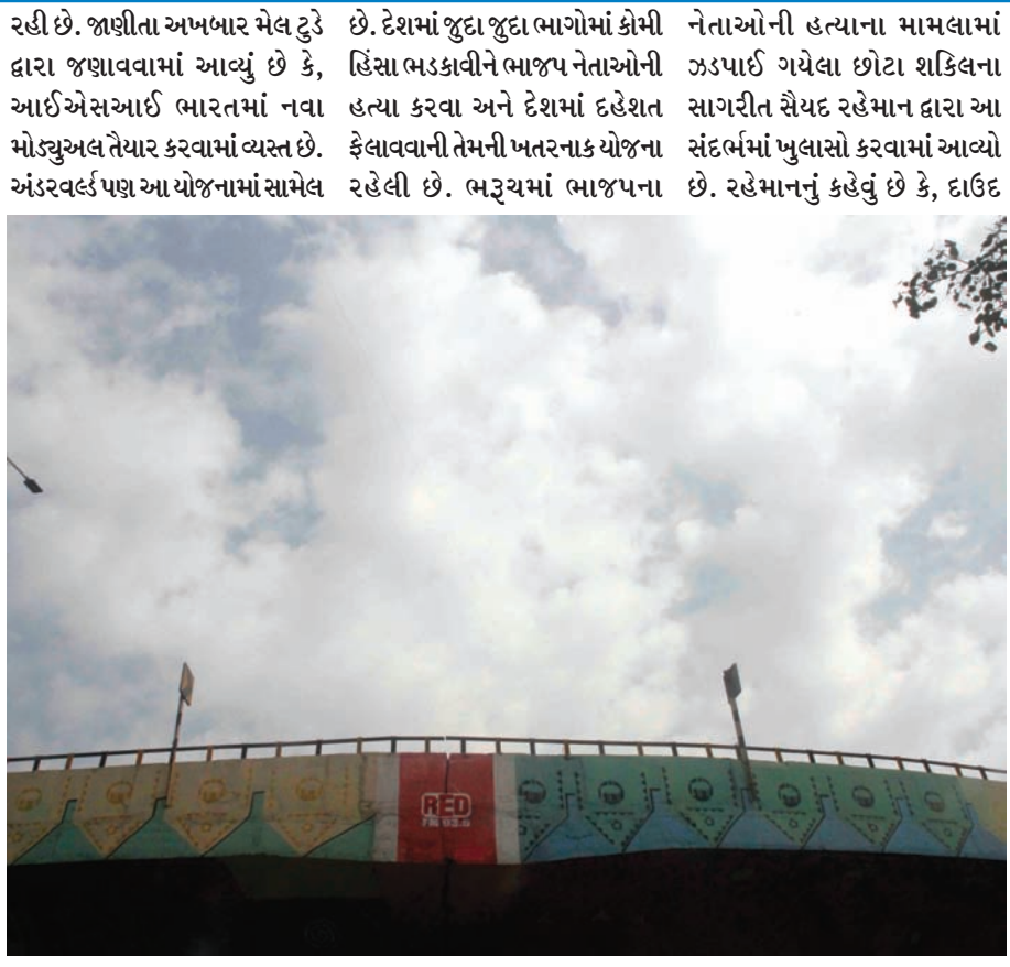
પલટાતું વાતાવરણ - છેલ્લા ૪૮ કલાકમાં તાપમાનમાં ભારે ફેરફારો નોંધાયા છે... ૧૩.૫ ડિગ્રી સુધી ઉતરેલો પારો ત્રણ દિવસમાં ૨૦.૫ ડિગ્રી પર પહોંચ્યો છે... ગરમી-ઠંડી, ઠંડી-ગરમીની વચ્ચે સોમવારે બપોર બાદ વાદળો ઘેરાયા હતા. ઠંડી પવન અને ઘેરાયેલા વાદળોથી વરસાદ આવવાની શક્યતાઓ અનુભવાતી હતી... જોકે રાજ્યના કેટલાક ભાગોમાં છૂટાછવાયા વરસાદના અહેવાલો પણ છે... પલટાતું વાતાવરણ પાકના ઉત્પાદન પર અસરકર્તા બને છે...

ઉત્તર ભારતમાં પુનઃ એકવાર ભૂંકપનો આંચકો નવી દિલ્હી, એનસીઆર અને કાશ્મીરના વિવિધ ભાગોમાં તીવ્ર આંચકાથી લોકોમાં ભય નવી દિલ્હી, તા. ૨૩ ઉચ્ચ હવા. પાકિસ્તાનના ભૂકંપ સાથે સંબંધિત વિભાગે માહિતી આપતા કહ્યું હતું કે ધરતીકંપની તીવ્રતા રિક્ટર સ્કેલ પર ૬.૨ જેટલી આંકવામાં આવી છે. આંચકાના કારણે અફઘાનિસ્તાનના પાટનગર કાબુલમાં પણ લોકો દહેશતમાં રહ્યા હતા. અમેરિકાના વિભાગે કહ્યું હતું કે ધરતીકંપનું કેન્દ્ર અફઘાનિસ્તાનના પાટનગર કાબુલથી આશરે ૩૦૦ કિલોમીટરના અંતરે સ્થિત હતું. જમીનની નીચે કેન્દ્ર હોવા છતાં તેની અસર જોવા મળી હતી. બીજા બાજુ તાજેતરના સમયમાં નેપાળ, ચીન, ઈસ્લામાબાદ, લાહોર અને પેશાવર ● અનુસંધાન પાન-૭ પર