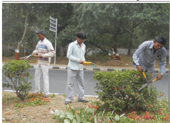
ગાંધીનગર શહેરને આકર્ષક બનાવવા તંત્ર દ્વારા કામગીરી ચાલુ રાખે છે જેને અનુલક્ષીને શહેરમાં ઘ-રોડ પર વીપાઈડરની વચ્ચે વાવેલા વૃક્ષોનાં ટ્રીમીંગનું કામ હાથ ધરવામાં આવ્યું છે.