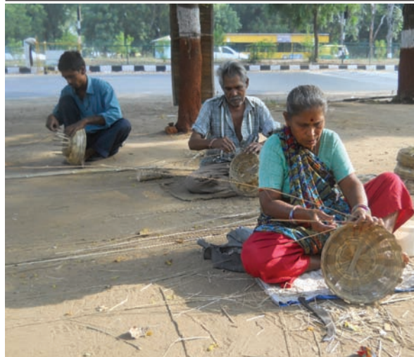
આમ તો અત્યારે સ્ટીલ, મેલેમાઈન અને કોપર બોટમાં વાસણો અને પ્લાસ્ટીકના સ્ટોરેજની પ્રથા ચાલે છે, પરંતુ તેમ છતાં ઘરનાં વિવિધ કામો માટે વાંસની ટોપલીઓ ક્યાંક ક્યાંક કામ આવે છે ખરી.