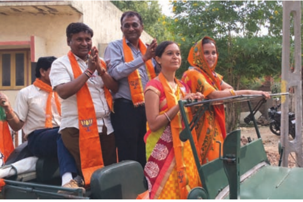
પ્રથમવાર નવી વોર્ડ રચનાનુસાર નગરપાલિકાની ચૂંટણી યોજાઈ રહેલ હોવાથી મતદારોની સંખ્યાનો વધારો અને હાઈવે વિસ્તારની અને સોસાયટીઓ વોર્ડ નં. ૮મા સમાવેશ થતાં વિકાસના મુદ્દાને લઈને ભારતીય જનતા પાર્ટીના ઉમેદવારો પાર્ટીએ તમામ નવા ચહેરાને મેદાનમાં ઉતાર્યાં છે.